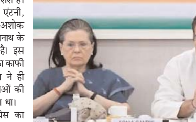
पार्टी का प्रदर्शन कमजोर रहा। ऐसे में जनवरी-फरवरी में होना तय है। इसके लिए चुनाव प्राधिकरण ने सभी

जनवरी-फरवरी में होना तय है। इसके लिए चुनाव प्राधिकरण ने सभी