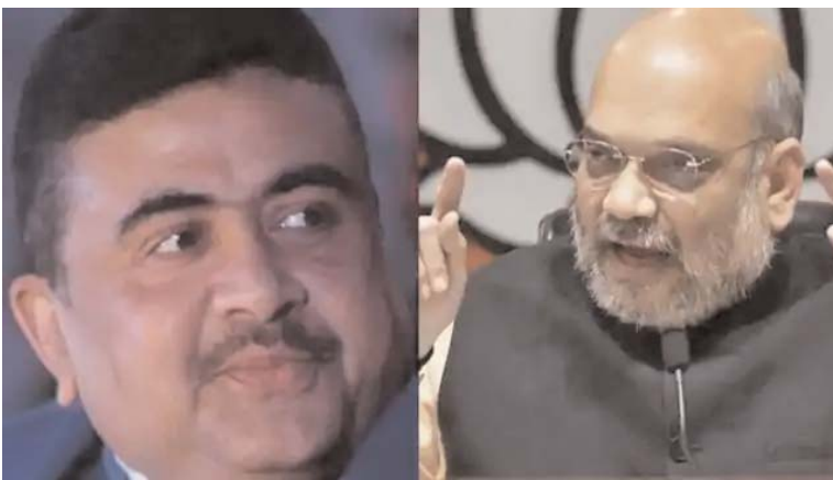
पश्चिम बंगाल में अगले साल होने वाले विधानसभा मुताबिक शाह शनिवार को 10-45 बजे कोलकाता

चुनावों के मद्देनजर पार्टी की कई रणनीतिक बैठकों में भाग लेंगे। भाजपा की ओर से जारी प्रेस विज्ञापन के