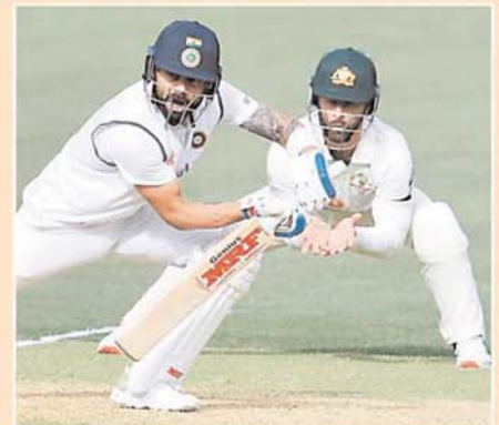
पृथ्वी शॉ मैच की दूसरी बॉल पर आउट मैच में भारतीय टीम की शुरुआत बेहद खराब रही। टीम ने 32 रन पर ही दो विकेट गंवा दिए। ओपनर पृथ्वी शॉ मैच की दूसरी बॉल पर ही बिना खाता खोले पॉलीविन लीट गए। मिचेल स्टार्क ने उन्हें बॉल देकर। इसके बाद मयंक अग्रवाल भी 17 रन बनाकर चले बने। तेज गेंदबाज फेट कमिस ने उन्हें बलीन बॉल देकर।

एडिलेड ■ एजेसी भारत और ऑस्ट्रेलिया के बीच एडिलेड ओवल में खेले जा रहे 4 टेस्ट की सीरीज के पहले मैच का पहला दिन खत्म हो गया। इस डे-नाइट टेस्ट में टॉस जीतकर पहले बल्लेबाजी करते हुए भारतीय टीम ने पहले दिन 6 विकेट गंवकाकर 233 बनाए। कप्तान विराट कोहली ने टेस्ट करियर की अपनी 23वां फिफ्टी लगाई। ऋद्धिमान साहा (9) और रविचंद्रन अश्विन (15) नाबाद हैं। कोहली ने 180 बॉल पर सबसे ज्यादा 74 रन की पारी खेली। उन्होंने एडिलेड में अपने टेस्ट करियर के 500 रन भी पूरे कर लिए। यह उपलब्धि हासिल करने वाले वे पहले भारतीय खिलाड़ी हैं। कोहली का यह एडिलेड में चौथा टेस्ट है। उन्होंने अब तक 7 पारियों में 505 रन बनाए। इस दौरान 3 शतक और एक अर्धशतक भी जड़ा। कोहली के बाद राहुल द्रविड़ ने 4 टेस्ट की 8 पारियों में 401 रन बनाए हैं। कप्तान विराट कोहली चौथे विकेट के तौर पर आउट हुए। उन्होंने राहुल के साथ चौथे विकेट के लिए 168 बॉल पर 88 रन की