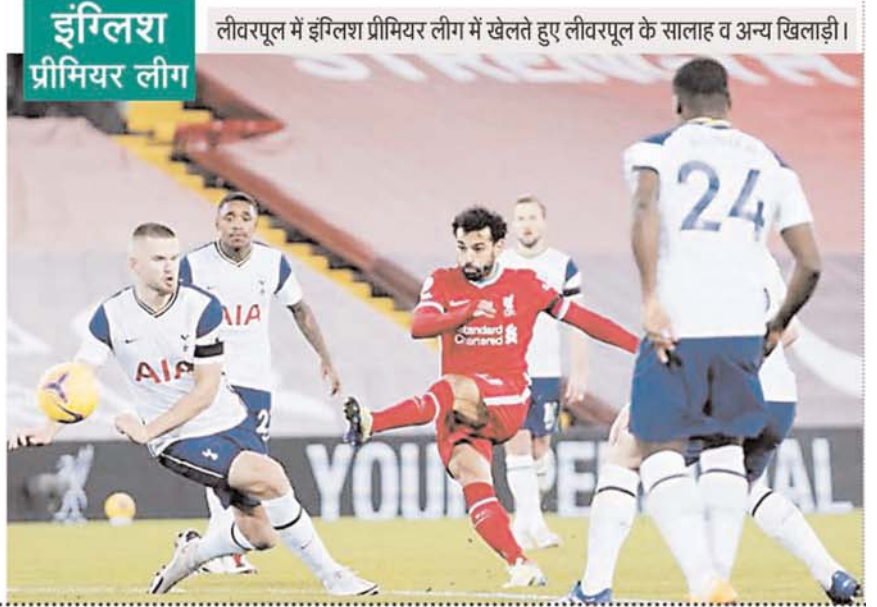
इंग्लिश प्रीमियर लीग