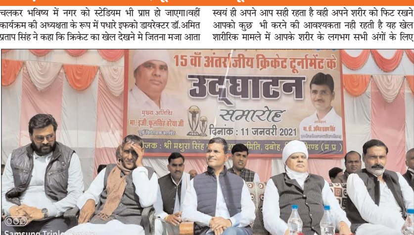
है उससे कई गुना ज्यादा मजा व लाभ उसे खेलने से मिलता है। क्रिकेट के मैदान पर आपको शारीरिक और मानसिक दोनों तरह से कार्य करना पड़ता है जिससे आपकी मांसपेशियां मजबूत होती हैं और आपका संतुलन, गति और स्फूर्ति तोनी बढ़ती है। यह एक ऐसा खेल है जिसको खेलने से आपको अपने शारीरिक स्वास्थ्य को लेकर कोई चिंता करने की जरूरत नहीं होती है। आपका स्वास्थ्य लाभदायक रहता है वहीं उन्होंने कहा कि यदि आपका बच्चा खेलों में भाग लेता है तो उनमें सामाजिक कौशल का बहुत अच्छा विकास होता है खेलों के दौरान आपका बच्चा अन्य बच्चों से मिलता है और उनसे बातचीत करता है यह उसके सामाजिक कौशल के विकास में सहायक होता है इसीलिए माता-पिता को कभी भी अपने बच्चों को खेलने से रोकना नहीं चाहिये। अंत में उन्होंने कहा कि युवाओं