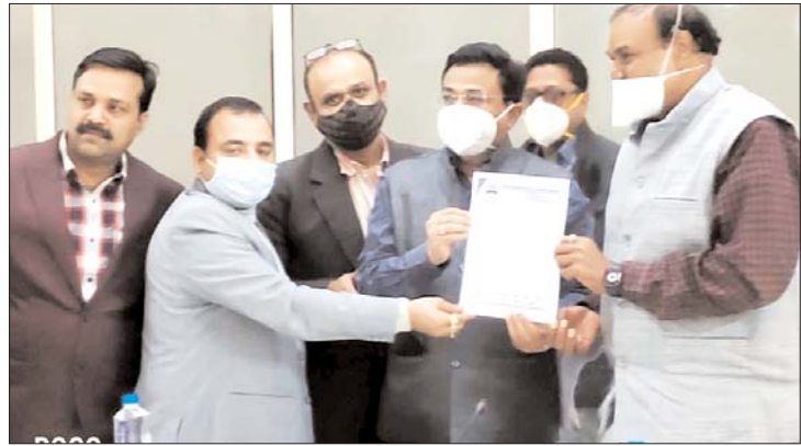
लेकर साधारण ब्याज लिया जायेगा। संभाग आयुक्त ने कहा कि जो दुकानदार चारों किशत जमा कर चुके

हैं वे अपने शोरूम शुरू कर सकते हैं। साथ ही यह भी कहा कि कुछ समय तक माधव प्लाजा के