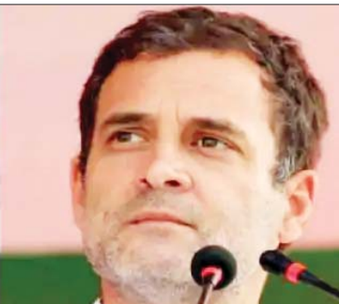
-राहुल गांधी और प्रियंका गांधी ने कांग्रेस के उन सांसदों से मुलाकात की जो जंतर-मंतर पर कृषि कानूनों के खिलाफ प्रदर्शन कर रहे हैं। राहुल गांधी और प्रियंका गांधी के नेतृत्व में