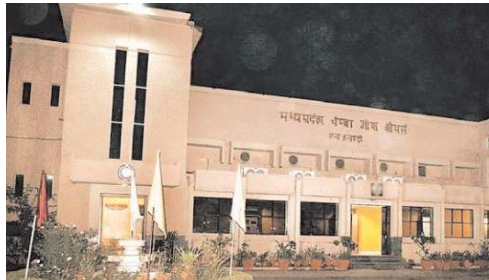
वितरण कंपनी द्वारा बैंक स्वीकार न करने के कारण हजारों उपभोक्ताओं को परेशानियों का सामना करना