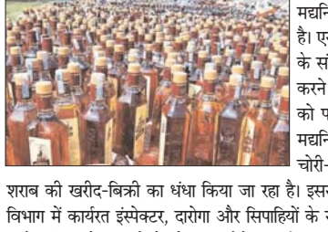
शराब की खरीद-बिक्री का धंधा किया जा रहा है। इससे शराबबंदी कानून का मजाक उड़ रहा है। उन्होंने विगत वर्षों से उत्पाद विभाग में कार्यरत इम्पेक्टर, दारोगा और सिपाहियों के साथ उनके रिश्तेदारों की चल-अचल संपत्ति की जांच करने के साथ ही इनके परिवार के सदस्यों के मोबाइल लोकेशन की जांच करने को कहा है। यह पत्र 6 जनवरी को लिखा गया है।

पटना। बिहार में शराबबंदी के बावजूद शराब का धंधा होने को लेकर एसपी मद्यनिपेध ने उत्पाद विभाग के अधिकारियों की भूमिका पर सवाल खड़ा किया है। एसपी द्वारा शराब के धंधे में उत्पाद विभाग के इम्पेक्टर, दारोगा और सिपाही के संलिप्त होने का आरोप लगाते हुए इनके और रिश्तेदारों की संपत्ति की जांच करने को कहा गया है। इस बाबत उन्होंने सभी जिलों के एसपी और एसपी को पत्र लिखा है। यह पत्र सोशल मीडिया पर भी वायरल हो गया है। एसपी मद्यनिपेध द्वारा लिखे गए पत्र में कहा गया है कि बिहार के सभी थाना क्षेत्र में चोरी-छुपे उत्पाद विभाग के इम्पेक्टर, दारोगा और सिपाही को चढ़वा चढ़कर शराब की खरीद-बिक्री का धंधा किया जा रहा है। इससे शराबबंदी कानून का मजाक उड़ रहा है। उन्होंने विगत वर्षों से उत्पाद विभाग में कार्यरत इम्पेक्टर, दारोगा और सिपाहियों के साथ उनके रिश्तेदारों की चल-अचल संपत्ति की जांच करने के साथ ही इनके परिवार के सदस्यों के मोबाइल लोकेशन की जांच करने को कहा है। यह पत्र 6 जनवरी को लिखा गया है।