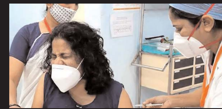
सत्र के जरिए 1,77,368 लाभाधी को टीका लगाया गया मंत्रालय ने मंगलवार को कहा कि टीका लगाने

के बाद प्रतिकूल प्रभाव (एड्वाइज) के केवल नौ मामलों में अस्पताल में भर्ती कराने की आवश्यकता