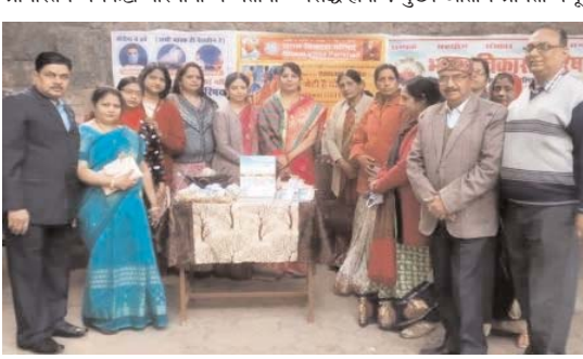
कि परिषद की शाखा द्वारा बेटियों के तन और मन के विकास के लिए गुड़ चना लोहे की कढ़ाई तथा पढ़ाई के लिए