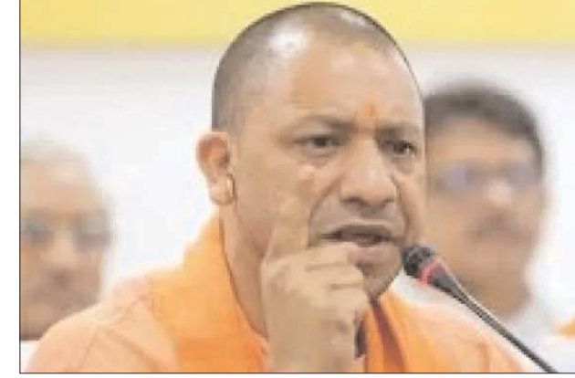
जेम पोर्टल सरकार और उद्यमियों के लिए बहुत फायदेमंद प्लेटफॉर्म है। सरकारी विभागीय खरीदारी में पारदर्शिता लाने और भ्रष्टाचार रोकने में यह राष्ट्रीय स्तर पर दूसरे प्रदेशों के लिए भी अनुकरणीय है। इसके यूपी में लागू होने से निस्संदेह पिछली सरकारों से चले आ रहे सैकड़ों करोड़ के भ्रष्टाचार

अवार्ड से सम्मानित किया है। इस समय प्रदेश राष्ट्रीय स्तर पर जेम पोर्टल के माध्यम से सर्वाधिक खरीदारी करने वाला पहला राज्य है। इस साल दिसंबर तक 71814 विक्रेता भी जेम पर पंजीकृत हैं, जिसमें से 26029 एमएसएमई ईकाईयां हैं। मैनपावर आउटसोर्सिंग, टैक्सी, सफाई आदि सेवाएं भी जेम पोर्टल पर-जेम पोर्टल से खरीदारी सरकार की सर्वोच्च प्राथमिकता है। पोर्टल के माध्यम से विभागों के लिए खरीदारी को गुणवत्तापूर्ण, पारदर्शी और मितव्ययी बनाया गया है। प्रदेश के कुछ विभागों की ओर से जेम पोर्टल पर उपलब्ध सेवाओं का क्रय ई टेंडर से भी किया जा रहा है। कई विभागों की ओर से उत्पादों के साथ मैनपावर आउटसोर्सिंग, टैक्सी, सफाई आदि सेवाएं भी जेम पोर्टल से ली जा रही हैं। पोर्टल पर आपूर्तिकर्ताओं, विक्रेताओं के साथ विविध वस्तुओं और सेवाओं की एक विस्तृत श्रृंखला है। क्या है जेम पोर्टल-जेम पोर्टल एक ऐसा प्लेटफॉर्म है, जहां पर 70 हजार से ज्यादा विक्रेता पंजीकृत हैं। इन विक्रेताओं के हजारों उत्पाद भी निर्धारित दर और मानक के अनुसार उपलब्ध हैं। चूंकि सरकार की ओर से आदेश है कि जो उत्पाद या सेवाएं जेम पोर्टल पर उपलब्ध हैं, उनकी खरीदारी अनिवार्य रूप से जेम पोर्टल से ही की जाएगी।