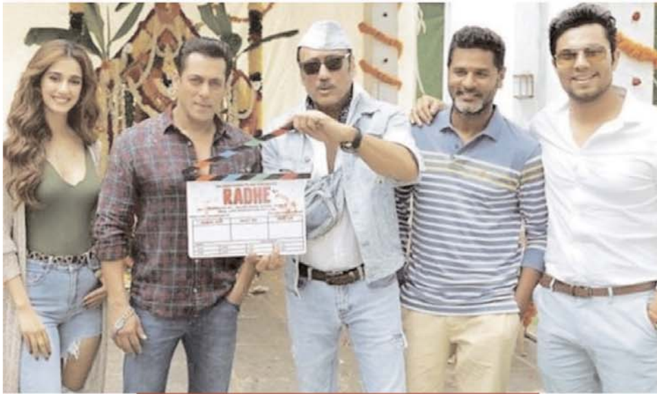
मोस्ट वॉन्टेड भाई का फैसला