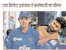
एक क्रिकेट प्रशंसक ने बल्लेबाजी का मीम्स शेयर करते हुए दिखाया कि कैसे पुजारा पिच पर विकेट के आगे फाड़ती तरह खड़े हो गए हैं। टीम इंडिया को दूसरी पारी में अंतिम टेस्ट जीतने के लिए 328 रनों की जरूरत थी, तब देवशर पुजारा कंगारूओं के सामने दीवार बनकर खड़े हो गए। चौथी पारी में बल्लेबाजी में मुश्किल के बाद भी पुजारा टिके रहे। उन्होंने भारत को मजबूत स्थिति में पहुंचाया और 211 गेंदों पर 56 रनों की शानदार पारी खेली। फिल्म गैंग्स ऑफ वासेपुर की तस्वीरों को शेयर करते हुए ट्विटर यूजर ने लिखा पूरा इलाका घुआ घुआ हो गया।

मुंबई ब्रिस्बेन टेस्ट में ऑस्ट्रेलिया को तीन विकेट से हराकर युवा टीम इंडिया ने इतिहास रच दिया। भारत की शानदार जीत के बाद सोशल मीडिया पर टीम इंडिया के प्रशंसक बेहद खुश हैं, और अब टीम इंडिया ट्विटर पर टैंड कर रही है।