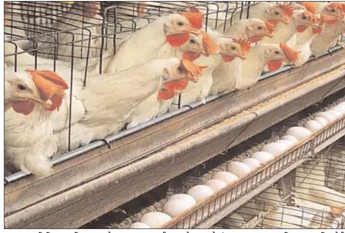
शाजापुर, विदिशा, दतिया, अशोकनगर, बड़वानी, भोपाल, होशंगाबाद, बुरहानपुर, छिन्दवाड़ा, डिण्डोरी,