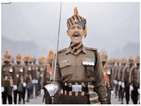
वितीय, लॉजिस्टिकल क्षमता, विकास की स्थिति और भौगोलिक ताकत शामिल है। यह रैंकिंग ऐसे समय आई है, जब भारत का अपने पड़ोसियों चीन और पाकिस्तान के साथ

नई दिल्ली = यूरो दुनियाभर के 138 देशों की सैन्य ताकत का लेखा-जोखा बताने वाले ग्लोबल फायर पावर इंडेक्स ने 2021 की रैंकिंग जारी कर दी है। इसमें भारत पिछली रैंकिंग बरकरार रखते हुए चौथे स्थान पर है। पहले, दूसरे और तीसरे स्थान पर अमेरिका, रूस और चीन हैं। सबसे बड़ा उलटफेर पाकिस्तान ने किया है।