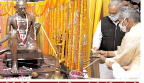
गांधीजी की विचारधारा को खंडित करने की कोशिश हो रही