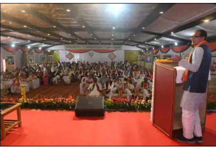
समुद्रशाली और शक्तिशाली भारत का भाजपा का कार्यकर्ता बड़े लक्ष्य के लिए निर्माण करना है, सीएम चौहान ने कहा

उज्जैन। उज्जैन में चल रहे बीजेपी के प्रशिक्षण वर्ग में मुख्यमंत्री शिवराज सिंह चौहान ने विधायकों को अच्छे नेता बनने के टिप्स दिये, उन्होंने कहा उस जनता और कार्यकर्ता के सम्मान में कहीं कमी न आने दें जिसने आपको नेता चुना है। पार्टी के तीन मंत्र राष्ट्रवाद, अंत्योदय और सुशासन को कभी न भूलें। मुख्यमंत्री शिवराज सिंह चौहान ने विधायकों से कहा कि आप गृहमंत्री के साथ प्रदेश की सामाजिक और राजनीतिक स्थिति का अध्ययन कीजिए, अपने विचार-परिचय को समझिए और इस बात पर चिंतन कीजिए कि समाज ने आपको जनप्रतिनिधि चुना है, तो आपका सामाजिक दायित्व क्या है। हमें इस बात पर गर्व है कि हम उस स्तर के विधायक हैं, जिसकी प्रेरणा राष्ट्रवाद है, लक्ष्य अंत्योदय है और मंत्र सुशासन है। हम सभी को मिलकर एक गौरवशाली, वैभवाशाली,