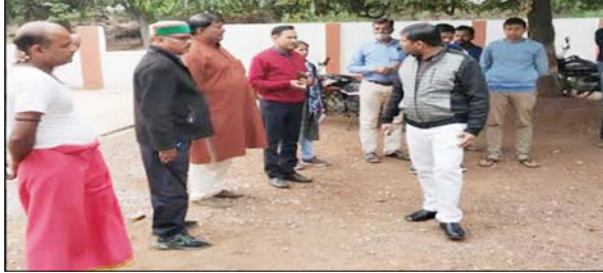
आग्रामी ग्रीष्म ऋतु को ध्यान में रखकर ग्रामीण अंचल में अभी से पेयजल को उत्सुकता के लिए पर्याप्त होनामा किया जाये। बंद-जल योजनाओं को अभियान बतौर चलाये साथ ही हेडपंपों का संभारण भी तेजी से किया जाए। जनपद पंचायत मुरार के मुख्य कार्यपालन