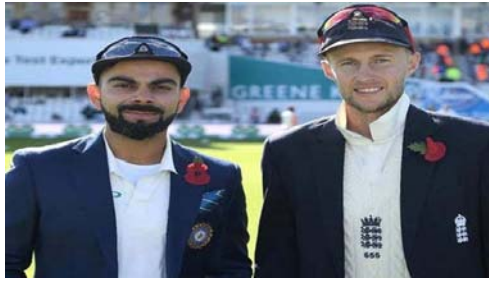
ही लग रही है। टर्निंग पिच पर वह वाशिंगटन सुंदर से बेहतर विकल्प है लेकिन बल्लेबाजी को तबज्जो देने पर हरफनमौला हार्दिक पंड्या को उतारा जा सकता है। सुंदर आने वाले समय में बेहतर गेंदबाज बन सकते हैं लेकिन अभी वह तीसरे हरफनमौला बन सकते हैं लेकिन अभी वह तीसरे

चेन्नई। टीम इंडिया रविवार से यहां इंग्लैंड के खिलाफ शुरू हो रहे दूसरे टेस्ट मैच में जीत के साथ ही सीरीज में वापसी के इरादे से उतरेगी। पहले टेस्ट मैच में बल्लेबाजों के नाकाम रहने से भारतीय टीम को करारी हार का सामना करना पड़ा था। ऐसे में भारी टीम इस मैच में अपनी पिछली गलतियों से सबक लेकर बड़ा स्कोर बनाना चाहेगी। टीम के कप्तान विराट कोहली पर भी इस मैच में बेहतर प्रदर्शन कर जीत दिलाने का दबाव रहेगा। पहले टेस्ट में आर अश्विन के अलावा अन्य भारतीय गेंदबाजों प्रभावहीन रह चुके थे। इस मैच में भारतीय टीम हारी तो विश्व टेस्ट चैंपियनशिप के फाइनल में पहुंचने का उसका सपना भी टूट जाएगा। इस मैच से एक बार फिर मैदान पर दर्शकों की नजर आयेगी। कोरोना महामारी के कारण अब तक सभी मैच दर्शकों के बिना खाली स्टेडियम में हो रहे थे। इस मैच में विमन ऑलराउंडर अक्षर पटेल की वापसी तय है। उन्हें शाबाज नदीमी की जगह शामिल किया जाएगा। नदीम पहले टेस्ट मैच में अपनी गेंदबाजी से प्रभावित नहीं कर पाये थे। अक्षर गेंदबाजी के साथ ही निचले क्रम पर बल्लेबाजी भी कर सकते हैं। वहीं यासमान गेंदबाज कुलदीप यादव के चयन को संभावना कम