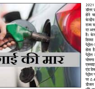
महंगाई की मार

नई दिल्ली। बढ़ती महंगाई ने देश के आम नागरिक को जीना दुःख कर दिया है। पेट्रोल और डीजल की लगातार बढ़ती कीमतों के कारण भी ऐसा हुआ है। जबकि पेट्रोलियम मंत्री धर्मेश प्रधान ने कहा कि ईंधन की कीमतें अब तक के उच्च स्तर पर होने का झुझझका कर दिया है। देश में पेट्रोल और डीजल की कीमतें एक अंतरराष्ट्रीय मूल्य प्रणाली के तहत निर्धारित होती हैं। उन्होंने राजस्थान में बताया कि पिछले 300 दिनों में करीब 60 दिन तक कीमतों में वृद्धि हुई है। पेट्रोलियम मंत्री ने एक तरह से संकेत दे दिया कि सरकार पेट्रोल पर केन्द्रीय उत्पाद शुल्क में कटौती नहीं करेगी। ऐसे में महंगाई बढ़ने का अंदाजा है। धर्मेश प्रधान का कहना है कि सार्वजनिक क्षेत्र की ऑयल मार्केटिंग कंपनियों (ओएमसी) ने अंतरराष्ट्रीय उत्पाद की कीमतों और बाजार की अन्य स्थितियों के अनुसार पेट्रोल और डीजल के मूल्य निर्धारण पर प्रभुत्व निर्माण किया है। तेल कंपनियों ने अंतरराष्ट्रीय कीमतों में परिवर्तन और सपे की विविधता के अंतर्गत पेट्रोल और डीजल की कीमतों में केवल वृद्धि ही नहीं की बल्कि कमी भी की है। करीब 250 दिनों तक हमने कीमतों