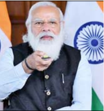
"महाबद्ध-ब्रह्मपुत्र" जलमार्ग का लोकपरिचय, धुबरी-फुलबाड़ी पुल की आधारभूत, माजुली सेतु के लिए किया भीमपूजन

गुवाहाटी। आगामी विधानसभा चुनाव से पहले प्रधानमंत्री नरेन्द्र मोदी ने ब्रह्मपुत्र नदी को असम को कई विकास परियोजनाओं की सीमा दे दी और कहा कि उनको सरकार पूर्वी तट के इस राज्य को नवअंदाज करने की "ऐतिहासिक गलती" को ना सिर्फ सुधार रही है, बल्कि तेज गति से उसके विकास के लिए प्रयत्न कर रही है। इस अवसर पर प्रधानमंत्री ने इस क्षेत्र की भौगोलिक और सांस्कृतिक दृष्टियों को ध्यान देने का प्रयास किया है। उन्होंने कहा, "गुजराती के कालखंड में भी असम देश के सम्पन्न और अधिक राज्य देने वाले राज्यों में से था। संकेत का जाल असम को समृद्धि का बड़ा कारणा था। आबादी के बाद इस अवसर का औद्योगिक बनाना जरूरी था, लेकिन इन्हें अपने ही हस्त पर छोड़ दिया गया। उन्होंने कहा कि पूर्व प्रधानमंत्री अटल बिहारी वाजपेयी ने इतिहास में की गई "गलती" को सुधारने की कोशिश की थी, अब उनका ना सिर्फ विरासत किया जा रहा है बल्कि उन्हें और गति दी जा रही है। उन्होंने कहा, यह अब हमारा प्राथमिकता में है और हमें इसके लिए सरकार दिन रात एक कर रही है। प्रधानमंत्री ने कहा