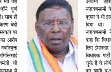
पुडुचेरी के मुख्यमंत्री नारायणसामी ने सदन में विश्वास मत प्रस्ताव पेश किया।

पुडुचेरी। पुडुचेरी में सीएम नारायणसामी की कांग्रेस-इस्तीफा करके के रिहा विधानसभा का एक दिन का विश्वास सत्र हुआ। मुख्यमंत्री ने सदन को बताया कि उनकी सरकार के पास बहुमत नहीं है।