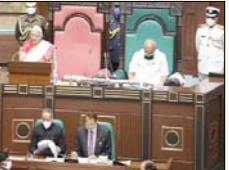
राज्यपाल आनंदी बेन पटेल ने मध्य प्रदेश विधानसभा में अभिभाषण किया।

प्रदेश में नवकरणीय ऊर्जा में 10 गुना वृद्धि हुई है। उन्होंने कहा कि राज्य सरकार ने कोरोना काल में बेहतर काम किया। इस चुनौती का बेहतर तरीके से सामना किया। पीपीई किट, टेस्टिंग किट और अस्पतालों में कोरोना संक्रमितों के लिए बेड का प्रबंधन समय रहते किया। फंड लाइन बकर्स और कोरोना योद्धाओं ने प्रधानमंत्री नरेंद्र मोदी के आभार जताए।