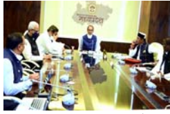
मुख्यमंत्री निरंजन सिंह चौहान ने कहा कि कोरोना के संघ में लापरवाही से कोरोना विकराल रूप धारण कर लेगा।

भोपाल। मुख्यमंत्री श्री निरंजन सिंह चौहान ने कहा है कि कोरोना के संघ में लापरवाही से कोरोना विकराल रूप धारण कर लेगा। थोड़ी सी लापरवाही से कोरोना विकराल रूप धारण कर लेगा।