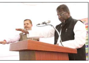
डॉ. चौधरी ने कहा कि सघन मिशन इन्द्रधनुष-3 अभियान प्रदेश के 7 जिलों भोपाल, भिण्ड, बुरहानपुर, छिंदवाड़ा, भालिसर, इंदौर और खरौन में संचालित किया जा रहा है। अभियान का दूसरा चरण 22 मार्च से आरंभित किया जाएगा। अभियान में टीकाकरण से छूटे हुए बच्चों और गर्भवती माताओं का टीकाकरण किया

भोपाल। लोक स्वास्थ्य एवं परिवार कल्याण मंत्री डॉ. प्रहलान चौधरी ने आज गीर्वाण नगर समुदायिक स्वास्थ्य केंद्र में सघन मिशन इन्द्रधनुष-3 अभियान का शुभारंभ किया। इस अवसर पर स्वास्थ्य मंत्री डॉ. चौधरी और विधायक हनुवर श्री गेभर शर्मा ने अभियान की शुरुआत बच्चों को पोलियो खुरदक मिले कर की। स्वास्थ्य मंत्री डॉ. चौधरी ने कहा कि प्रदेश में कोरोना काल की विपत्ति परिस्थितियों के बावजूद भी बच्चों और महिलाओं का टीकाकरण जारी रहा। इस अवधि में जोर से 5 वर्ष आयु के 29 लाख 33 हजार बच्चों और 8 लाख 48 हजार गर्भवती माताओं का टीकाकरण किया गया। उन्होंने बताया