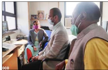
बैठक में आए सुझावों पर भी अमल करने का फैसला किया गया। साथ ही लोगों को सावधान रहने के लिए कहा गया।

ज्वालियर। महत्त्वपूर्ण रेलवे स्टेशन पर कोरोना को रोकने के लिए रेलवे स्टेशन पर थर्मल स्क्रीनिंग और कोरोना गाइडलाइन का पालन अनिवार्य होगा। रेलवे स्टेशन पर थर्मल स्क्रीनिंग और कोरोना गाइडलाइन का पालन अनिवार्य होगा। रेलवे स्टेशन पर थर्मल स्क्रीनिंग और कोरोना गाइडलाइन का पालन अनिवार्य होगा।