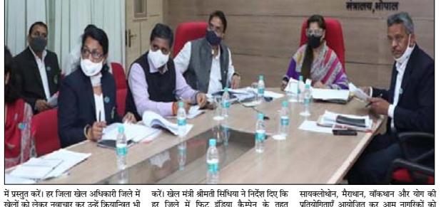
में प्रस्तुत करें। हर जिला खेल अधिकारी जिले में खेलों को लेकर नयाचार कर उन्हें क्रियान्वित भी करें। खेल मंत्री श्रीमती सिधिया ने निर्देश दिए कि हर जिले में फिट इंडिया केमैन के तहत सायकलोथोन, मेथामन, बॉक्सायन और योग की प्रतियोगिताएं आयोजित कर आम नागरिकों को

भोपाल। खेल एवं युवा कल्याण मंत्री श्रीमती यशोधरा राजे सिधिया ने कहा है कि खेल विभाग दो महत्वपूर्ण कमिटेयों पर विशेष रूप से कार्य कर रहा है। इसमें इन्क्वयिस्टिव हे राज्य में संचालित विभिन्न खेल अकादमियों और दूसरे एक्स्क्वयिस्टिव कमिटेयों हे ग्रामीण परिवेश में टैलेंट सर्च की। यह दोनों महत्वपूर्ण जिम्मेदारियों विद्या खेल अधिकारियों की होगी। श्रीमती सिधिया सोमवार को मंत्रालय स्थित पुनःआरंभ की 23 ज्वालियर, भोपाल, विदिशा, गुना, सागर, टिकमगढ़, दमोह, पन्ना, जबलपुर, नरसिंहपुर, बालासोड, मंडला, इंदौर, खरौन, झांझार, धार, उज्जैन, भोपाल, रायसेन, सी.पी. सिरोही, मुरारिन और सीकर जिले के खिला खेल अधिकारियों से वर्चुअल चर्चा कर रही हैं। खेल मंत्री श्रीमती सिधिया ने कहा कि अब हर जिले के अधिकारियों के सहयोग के लिए पहला युवा सम्मन्वयकों को जोड़ा गया है। उनसे अपेक्षा है कि अपने संबंधित जिले के हर तीन महीने, छ-महीने तथा साल भर की गतिविधियों को रिपोर्ट तैयार कर संचालनालय