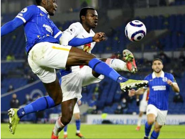
इंग्लैंड में इंग्लिश प्रीमियर लीग फुटबॉल में खेलते हुए डेनी वेल्बेक व टायरिक मिटसेल।