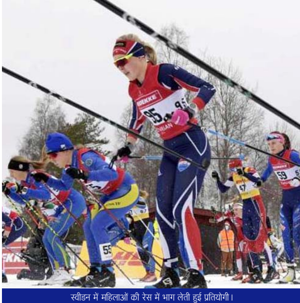
स्वीडन में महिलाओं की रेस में भाग लेती हुई प्रतियोगी।