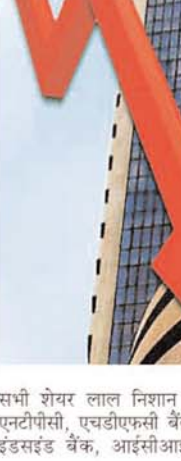
सभी शेयर लाल निशान पर बंद हुए। एनटीपीसी, एडीएफसी बैंक, एसबीआई, फार्मा, हिंदुस्तान यूनिटीवरी और मारुति के इंडसईड बैंक, आईसीआईसीआई बैंक, एसबीआई, टीसीएस, बजाज ऑटो, सन फार्मा, हिंदुस्तान यूनिटीवरी और मारुति के शेयर नुकसान पर बंद हुए। कल महाशिवरात्रि

के उपलक्ष्य में बुधश्रावित्य को घरेलू बाजार बंद रहे। इस उपलक्ष्य में प्रमुख घरेलू शेयर बाजारों बीएसई, नेशनल स्टॉक एक्सचेंज (एनएसई) और अंतरराष्ट्रीय मुद्रा विनिमय बाजार में कोई कारोबार नहीं हुआ। गौरतलब है कि पिछले तीन दिनों में कुल मिलाकर संसेक्स में 874.19 अंक यानी 1.73 प्रतिशत की तेजी आ चुकी है, जबकि निफ्टी 276.70 यानी 1.85 प्रतिशत मजबूत हुआ है। बता दें शेयर बाजारों में बुधवार को लगातार तीसरे दिन तेजी रही और बीएसई संसेक्स तथा एनएसई निफ्टी दोनों सूचकांक बढ़त के साथ बंद हुए। वैश्विक स्तर पर सकारात्मक रुख के बावजूद, आईटी और वाहन कंपनियों के शेयरों में तेजी से बाजार में मजबूती आयी। संसेक्स 254.03 अंक यानी 0.50 प्रतिशत की बढ़त के साथ 51,279.51 अंक पर बंद हुआ वहीं निफ्टी 276.40 अंक यानी 0.51 प्रतिशत मजबूत होकर 15,174.80 अंक पर।