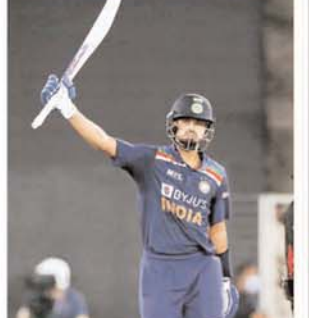
अख्यर की तीसरी फिफ्टी टीम इंडिया के ब्रेक्स अख्यर ने टी-20 में अपनी तीसरी फिफ्टी लगाई। उन्होंने 48 बॉल पर 67 रन की पारी खेली। उनके अलावा ऋषभ पंत ने 23 बॉल पर 21 और हाईक पड़या ने 21 बॉल पर 19 रन बनाए। इंग्लैंड के लिए तेज गेंदबाज जोना आर्चर ने 23 रन देकर 3 विकेट लिए। आदिल राशिद, मार्क वुड, क्रिस जॉर्डन और वेन स्टोक्स को 1-1 विकेट मिला।

पावरप्ले (1-6 ओवर) में टीम इंडिया की शुरुआत बेहद खराब रही थी। टीम ने 22 रन पर 3 बड़े विकेट गंवाए। भारतीय टीम का पावरप्ले में यह अपना दूसरा सबसे छोटा स्कोर रहा। इससे पहले टीम ने 2016 में पाकिस्तान के खिलाफ ढाका में 3 विकेट गंवाकर 21 रन बनाए थे। इंग्लैंड के कप्तान इयोन मॉर्गन ने मैच का पहला ओवर रिपन आदिल राशिद से कराया, जिसमें 2 रन आए। अगले ओवर में तेज गेंदबाज जोना आर्चर ने राहुल के तल्लिन बॉल कर दिया। अपने दूसरे और मैच के तीसरे ओवर में राशिद ने कोहली को कैच आउट कराया। 20 रन पर भारत को तीसरा झटका लगा। मार्श वुड ने धवन को वलिन बॉल किया। 48 रन के स्कोर पर ऋषभ पंत के रूप में भारत से चौथा विकेट गंवाया। पंत 23 बॉल पर 21 रन बनाकर आउट हुए। उन्हें वेन स्टोक्स ने जॉनी बेयरस्टो के हावी कैच आउट कराया। इसके बाद अख्यर ने हाईक पड़या के साथ 5वें विकेट के लिए 54 रन की पार्टनरशिप भी की। यहाँ हाईक 19 रन बनाकर आउट हुए। उन्हें जोना आर्चर ने कैच आउट कराया। आर्चर ने अमली ही बॉल पर शार्दूल ठाकुर को भी शून्य पर पवेलियन भेजा। भुवनेश्वर कुमार की डेढ़ साल बाद टीम में वापसी हुई। उन्होंने आखिरी मैच दिग्दर्शन, 2019 में वेस्टइंडीज के खिलाफ वनडे के आयरलैंड के खिलाफ 2018 में डब्लिन में 0 पर आउट हुए थे।