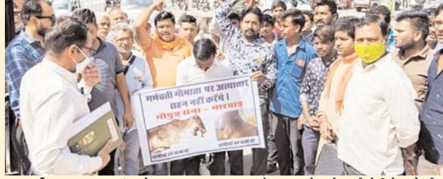
2. दुसरी घटना - नयागांव जोजावर, मारवाड़ जंक्शन विधानसभा क्षेत्र?। ज्ञापन के माध्यम से महोदयजी से निवेदन है कीया तीनों घटना की पुलिस कारवाही को गई मगर अभी तक कोई भी आरोपी नहीं पकड़ा गया। तुरन्त आरोपीयों को पकड़कर सजा दिलवाने हेतु शिकायत पत्र दिया गया।

तरह से बिखरा हुआ मुंह था गौपुत्र सेना के पाली जिला कार्यालय ने गौपुत्र सेना मारवाड़ को सुचना दी तब गौपुत्र सेना मारवाड़ की टीम एम्बुलेंस के साथ मौके पर पहुंची और उस गर्भवती व टूटे जवड़े वाली गौ माता को एम्बुलेंस में डलवाकर रात जाडन गौशाला हॉस्पिटल पहुंचाया गया जहां सुबह 7.00 बजे ईलाज के दौरान उस गर्भवती गौ माता की दर्दनाक मौत हो गई। इसी क्षेत्र के आस पास पिछले 04 माह में एसी ही घटना पहली भी 02 बार हो चुकी है जिसमें गौ माताओं को विस्फोटक पदार्थ खिलाकर मौत के घाट उतार दिया।