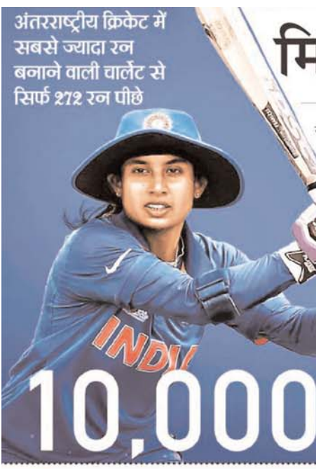
अंतरराष्ट्रीय क्रिकेट में सबसे ज्यादा रन बनाने वाली चार्लेट से सिर्फ 272 रन पीछे