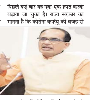
मध्य प्रदेश में कोरोना की संक्रमण रोकने में मदद मिली है। कुछ समय में ही

भोपाल। मध्य प्रदेश में कोरोना वायरस के नए मामलों में पिछले कुछ दिनों से कमी आ रही है। इस बीच, मुख्यमंत्री शिवराज सिंह चौहान ने मंगलवार को राज्य को अनलॉक करने की प्रक्रिया के बारे में ऐलान किया। उन्होंने बताया कि यह प्रक्रिया एक जून से शुरू होने जा रही है। इस हिसाब से मध्य प्रदेश में जल्द ही लोगों को लंबे समय ले लागू लॉकडाउन से निजात मिल जाएगी। कोरोना की वजह से मध्य प्रदेश के लगभग सभी जिलों में 31 मई तक कोरोना कर्फ्यू लागू है, जिसमें लॉकडाउन जैसी पाबंदियां लगाई गई हैं।