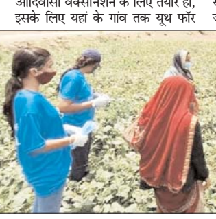
चिल्ड्रन के स्वयं सेवक पहुंच रहे हैं। युथ फॉर चिल्ड्रन के स्वयंसेवक गांव गांव जाकर लोगों का ऑक्सीजन लेवल चेक कर रहे हैं, लोगों को मास्क वितरण कर

मध्य प्रदेश। कोरोना संक्रमण की रफ्तार को रोकने का बड़ा हथियार वैक्सीनेशन माना जा रहा है, इसके लिए जरूरी है कि आमजन में जागृति आए और वे वैक्सीन लगवाने तैयार हों। आदिवासी अंचलों में लोगों में तरह-तरह की भ्रांतियां हैं, इसे दूर करने के लिए धार जिले में युथ फॉर चिल्ड्रन द्वारा गांव-गांव और खेत-खेत तक पहुंचकर अभियान चलाया जा रहा है। धार जिले का नालछ क्षेत्र आदिवासी बाहुल्य है और यहां के लोगों में कोरोना को लेकर डर है, वे वैक्सीनेशन के लिए आसानी से तैयार नहीं हो रहे हैं। यहां फॉर चिल्ड्रन के स्वयंसेवक गांव गांव समझ ही नहीं पा रहे हैं कि कोरोना को वैक्सीन से कैसे रोका जा सकता है।