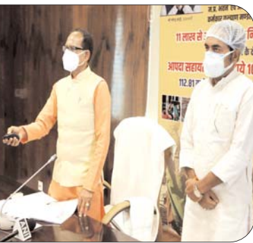
शासकीय अस्पतालों एवं अनुबंधित अस्पतालों में भी कोरोना का निःशुल्क इलाज हो रहा है। प्रदेश में कोरोना से माँ-बाप की मृत्यु पर बच्चों को पाँच हजार रुपये

कार्डधारी व्यक्ति एवं उसके परिवार को वर्ष में पाँच लाख रुपये तक सम्बद्ध निजी अस्पतालों में निःशुल्क इलाज की सुविधा दी गई है। इसके अलावा सभी