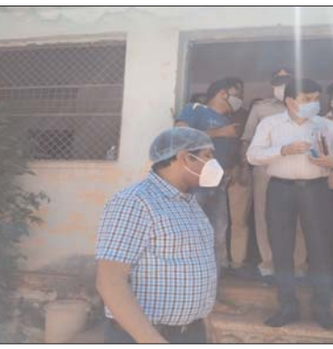
संक्रमण की रोकथाम के लिये सबसे प्रभावी उपाय टीकाकरण ही है। शतप्रतिशत लोग

यह भी कहा कि सर्वेक्षण के दौरान लोगों को टीकाकरण की जानकारी भी दी जाए। इसके साथ ही यह बताया जाए कि कोविड