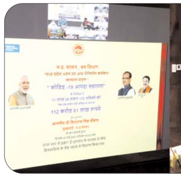
आपका भाई आपके साथ खड़ा है-मुख्यमंत्री श्री चौहान ने कहा कि सरकार कोविड उपचार योजना में कोरोना का निःशुल्क इलाज कर रही है। आयुष्मान

केन्द्र सरकार दे रही है। उन्होंने अधिकारियों को निर्देश दिए कि यह राशन प्रत्येक गरीब को मिल जाए, यह सुनिश्चित करें।