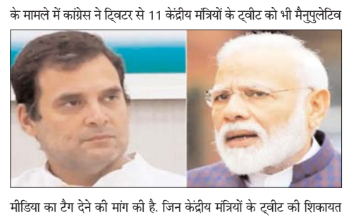
मोडिया का टैग देने की मांग की है। जिन केंद्रीय मंत्रियों के ट्वीट की शिकायत

दिल्ली। कोरोना वायरस को लेकर जारी कथित टूलकिट मामले में लगातार विवाद बढ़ता ही जा रहा है। इस मामले में पहले माइक्रोब्लॉगिंग साइट दिवटर को नोटिस भेजने के बाद दिल्ली पुलिस की स्पेशल टीम ने उसके दफ्तर पर पहुंचकर कल छानबीन की थी। दिल्ली पुलिस की एक टीम सोमवार को दिवटर के दिल्ली और हरियाणा स्थित दफ्तर पर पहुंची। दिल्ली पुलिस की स्पेशल टीम ने हरियाणा के गुरुग्राम और दिल्ली के लाडो सराय क्षेत्र में स्थित दिवटर दफ्तर पर पहुंचकर जांच-पड़ताल की है। टूलकिट मामले को लेकर दिवटर पर शेरार किए गए पोस्ट्स के नीचे मैनुपुलेटेड मीडिया लिखने को लेकर पुलिस ने कार्रवाई की और दिवटर को नोटिस भेजकर जवाब मांगा था। अब इसके बाद कांग्रेस प्रवक्ता रणदीप सुरजेवाला ने दिवटर को चिट्ठी लिखकर बीजेपी नेता संबित पात्रा की ही तरह कथित टूलकिट को शेरार करने वाले 11 केंद्रीय मंत्रियों के ट्वीट पर भी कार्रवाई करने की मांग की है। कथित टूलकिट