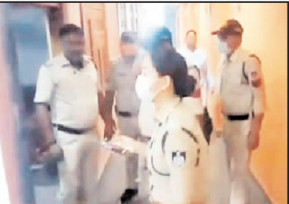
कराया। इसके बाद दलबल के साथ पहुंच गईं। जैसे ही वो होटल में पहुंची, तो हड़कंप मच गया। पुलिस ने होटल के कमरों को खुलवाया तो लडके और लडकियां आपत्तिजनक स्थिति में मिले। पुलिस ने होटल पढ़ने वाली छात्राओं के साथ कॉल गर्ल व महिला दलाल को भी पकडा। पुलिस के अनुसार पुलिस के मुताबिक शहर के नामी

नेता के संरक्षण में यह होटल संचालित है। होटल में उनके मेहमानों की आवभगत की जाती है। होटल में कॉलगर्ल से लेकर शराब भी सप्लाई होती आ रही थी। पुलिस ने होटल से शराब की खाली व सील पैक बोतलें बरामद की है। पुलिस ने यहां से एक डायरी भी जब्त की है, जिसमें कई लोगों के नाम दर्ज हैं। इसके साथ ही होटल को सील करने की कार्रवाई की गई है वहीं होटल संचालक सूचना पाते ही फरार हो गया है जिसकी गिरफ्तारी के लिए पुलिस मोबाइल के जरिए ट्रेस करने का प्रयास कर शोर्ष ही गिरफ्तारी करने का दावा कर रही है।