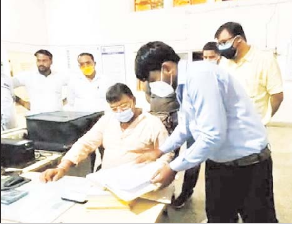
132 केव्ही स्टेशन पर पहुंचे मंत्री, अधिकारियों को सूचना लगते ही दौड़े दफ्तर

भिण्ड। ऊर्जा मंत्री प्रद्युमनसिंह तोमर अचानक अल्प प्रवास पर भिण्ड पधारे थे और रात लगभग 11 बजे आईटीआई फीडर पर निरीक्षण करने पहुंचे