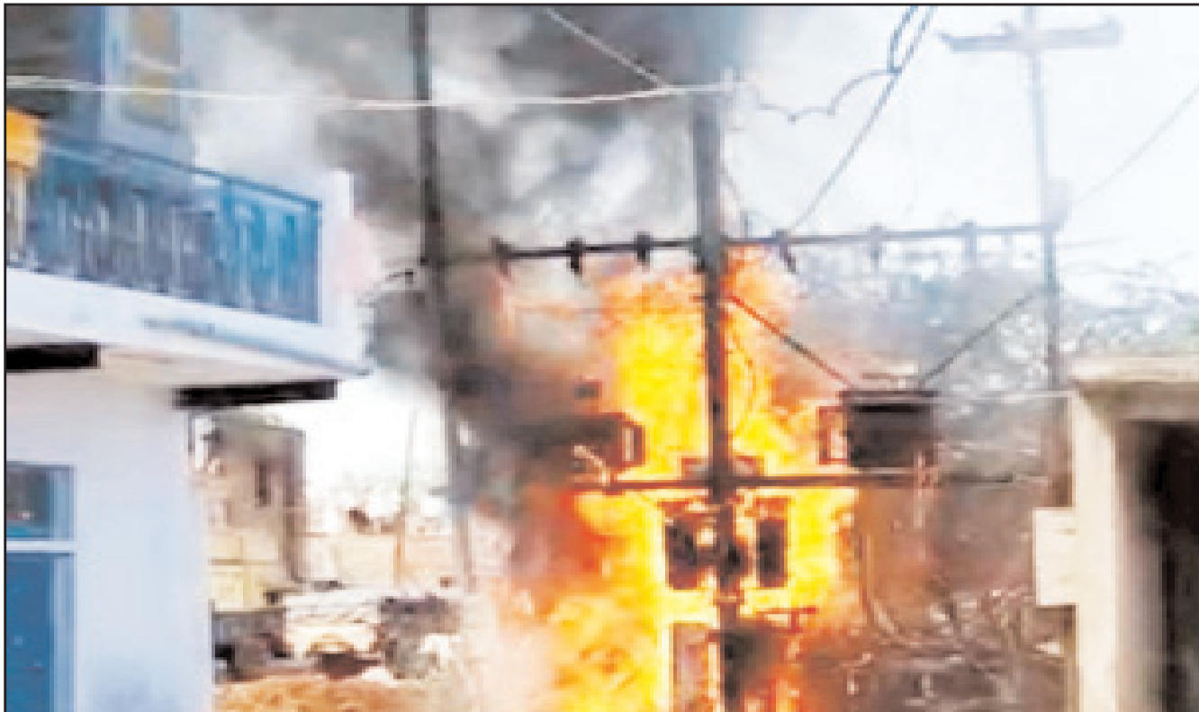
ज्यादा निकल रहे है। रात 12 बजे से सुबह 8 बजे तक एफओसी टीम नहीं होती है। रात के समय जो ऑन लाइन शिकायतें दर्ज कराई जाती

शहरी क्षेत्र के अलावा ग्रामीण व कस्बा स्तर पर हालात बुरे हैं। यहां बिजली के घंटिया उपकरण के साथ ही संसाधनों की कर्मी का रोना राया जा रहा है। यहां बिजली कंपनी पर्याप्त मात्रा में मानव संसाधन नहीं है। यही कारण है लहार, दबोह, आलमपुर, मिहोना, रौन, अटेर, फूप, अकोड़ा, गोरमी, मेहरांव, गोदह, मौ कस्बे में दो एफओसी टीम ही काम कर रही है। जबकि इन कस्बों में हर दिन फॉल्ट