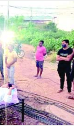
तीन के पार्ट खराब होने से ठीक नहीं हो सके। सरकारी अमले के काम न कराने से नाराज विधायक खुद मैकेनिक लेकर पहुंचे थे। इससे पहले वे सुबह 11.35 बजे