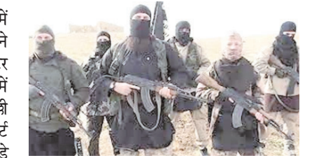
(आईएसआई) किसान आंदोलन के दौरान गड़बड़ी फैलाने की साजिश रच रहा है। खुफिया एजेंसियों के मुताबिक, आईएसआई किसानों को भड़काकर हिंसा फैलाने की कोशिश भी कर सकती है और आंदोलन में अपने लोगों को

नई दिल्ली (ए)। कृषि कानूनों के विरोध में प्रदर्शन कर रहे किसान आंदोलन को सात महीने पूरे हो गए हैं। इस अवसर पर किसानों ने ट्रैक्टर रैली निकालने का ऐलान किया है। दिल्ली में ट्रैक्टर रैली के बीच खुफिया एजेंसियों ने दिल्ली पुलिस के साथ ही अन्य एजेंसियों को अलर्ट किया कि पाकिस्तान स्थित आईएसआई से जुड़े लोग किसान आंदोलन के बहाने गड़बड़ी फैला सकते हैं। खुफिया एजेंसियों ने दिल्ली पुलिस और केंद्रीय औद्योगिक सुरक्षा बल (सीआईएसएफ) को अलर्ट किया है, इसकी वजह है कि पाकिस्तान स्थित इंटर-सर्विसेज इंटेलिजेंस