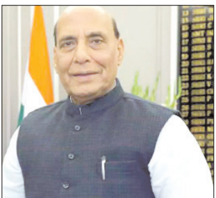
(सीएसटी) की तैयारी होती है जिनका आगामी महीनों में होना अपेक्षित है। स्वदेशी विमानवाहक पोत को 2022 की पहली छमाही में आईएनएस विक्रांत के रूप में नौसेना में कमीशन किया जाएगा, जो समुद्र में सबसे शक्तिशाली परिसंपत्ति होगी। यह जहाज मिंग-29के लड़ाकू विमान, कामोव-31 एयर अल्टी वॉरिंग हेलीकॉप्टरों का