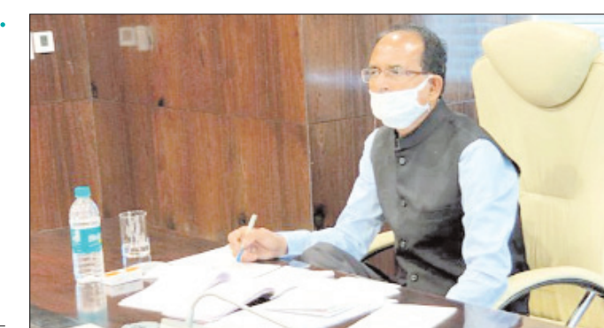
किया गया है कि शासकीय उचित मूल्य की दुकान का नाम ऐसा रखा जाएगा जिसमें किसान भी शामिल हों। साथ ही इनके लिए अलग से एक निश्चित स्थान सुनिश्चित किया जाएगा। इतना ही नहीं, इन दुकानों

भोपाल। प्रदेश की शिवराज सरकार सरकारी उचित मूल्य की राशन दुकानों का अब रंग बदलने जा रही है, साथ ही इन दुकानों का स्थान भी तय किया जाएगा। इतना ही नहीं, अब दुकानों में सरकार की प्रमुख योजनाओं का नाम भी दर्ज होगा। राज्य सरकार राशन दुकानों का स्वरूप जल्द ही बदलेगी।