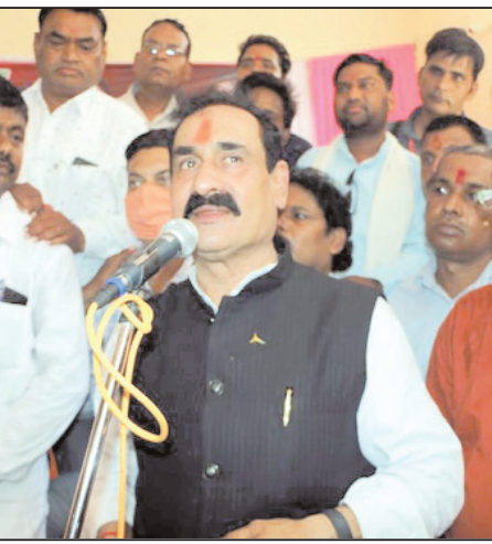
पर भगवान बुद्ध और डॉ. अम्बेडकर की प्रतिमा पर माल्यार्पण भी किया। गृह मंत्री डॉ. मिश्रा ने कार्यक्रम को संबोधित करते हुए कहा कि दतिया में 15 लाख रुपये की लागत से नवनिर्मित सामुदायिक भवन से समाज के लोगों को सामाजिक एवं वैवाहिक कार्यक्रमों के आयोजन के लिए सुविधा प्राप्त होगी। उन्होंने कहा कि इस भवन की काफी दिनों से आवश्यकता महसूस की जा रही थी जो आज पूर्ण हो गई है। मंत्री डॉ. मिश्रा ने कहा कि केन्द्र और राज्य सरकारों ने अनुसूचित जाति वर्ग के आर्थिक, सामाजिक एवं शैक्षणिक स्तर में सुधार लाने के लिए अनेक योजनाएं एवं कार्यक्रम संचालित कर इन वर्गों के लोगों को लाभान्वित कर समाज की

भोपाल। केन्द्र एवं राज्य सरकारों वसुधैव कुटुम्बकम के सिद्धांत पर सभी वर्गों के कल्याण और उत्थान के लिए कार्य कर रही है। हमारी सरकार ने संविधान निर्माता और भारत रत्न डॉ. भीमराव अम्बेडकर की स्मृति को चिर-स्थायी बनाने के लिए नागपुर, महु, दिल्ली एवं लंदन आदि को पंचतीर्थ बनाया है। गृह मंत्री डॉ. नरोत्तम मिश्रा शनिवार को दतिया में सामुदायिक भवन के लोकार्पण कार्यक्रम को संबोधित कर रहे थे। गृह मंत्री ने इस मौके