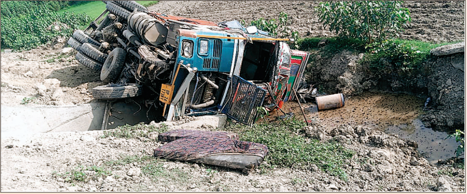
चालक तेज रफतार ट्रक से नियंत्रण खो बैठा और वह आगे जाकर चौधरी बदन सिंह महाविद्यालय के समीप सड़क के नाले में पलट गया। जिससे उसमें बैठा हुआ कंडक्टर ट्रक के नीचे दबकर गंभीर रूप से घायल हो गया। जब तक उसे ट्रक के नीचे से निकाला जाता तब तक उसकी मौत हो चुकी थी।

एटा। जनपद के थाना कोतवाली मलावन क्षेत्र के अंतर्गत सोमवार की सुबह लगभग 6 बजे जीटी रोड पर चौधरी बदन सिंह महाविद्यालय आसपुर के समीप एक तेज रफतार अनियंत्रित ट्रक पलटने से कंडक्टर की मौत हो गई। प्राप्त जानकारी के अनुसार कजरीया टाइल्स से भरा हुआ एक ट्रक सिकंदराबाद से गोरखपुर जा रहा था। आज सुबह लगभग छः बजे जैसे ही वह जीटी रोड पर छछैना नहर के पुल से गुजरा तभी