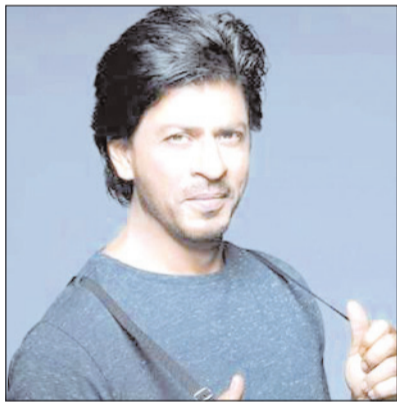
लिफ शाहरुख खान अब काफी इंटेंस शूट करने

कोरोन संक्रमण की घटती रफ्तार के बीच मुंबई में एक बार फिर फिल्मों की शूटिंग शुरू हो गई है। अमिताभ बच्चन, अजय देवगन और अक्षय कुमार के बाद अब शाहरुख खान भी सेट पर लौट आए हैं। शाहरुख ने अपनी अपकमिंग जासूसी-थ्रिलर फिल्म 'पठान' की शूटिंग दोबारा शुरू कर दी है। उनकी चमचमाती लग्जरी कार मुंबई में यशराज स्टूडियो के बाहर नजर आई। सिद्धार्थ आनंद के डायरेक्शन में बन रही इस फिल्म में शाहरुख के साथ दीपिका पादुकोण की जोड़ी नजर आने वाली है। 'लॉकडाउन के बाद पठान फिल्म की शूटिंग शुरू हो गई है। कोरोना की दूसरी लहर के कारण शूट बंद था। फिल्म के