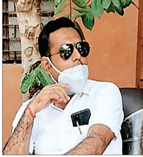
ब्यापारी माफियाओं से लेकर बाजरा बिक्री करने वाले

भाइयों को इन सभी परेशानियों के प्रति निजात मिली और अम्बाह एसडीएम की इस कार्यप्रणाली की जमकर सराहना हुई दूसरा उन्होंने जनता की परेशानी को देखकर अम्बाह ब्लॉक में प्रत्येक मंगलवार को जनता की समस्याओं को देखते हुये जनसुनवाई की मीटिंग रखना चालू की जो पहले अम्बाह ब्लॉक में कभी नहीं हुई जिसमे नगरपालिका से लेकर जनपद पंचायत अधिकारी व समस्त राजस्व पटबारियों को बुलाकर निराकरण करवाने की उनकी पहल नीब का पत्थर साबित हुई और अम्बाह पोरसा की जनता की छोटी छोटी समस्याओं से निजात मिली और राजस्व अपराधों में भी काफी गिरावट आई उसके उपरान्त देखा कि किसान भाई अपनी फसल की सही कीमत नहीं ले पा रहे रोड पर लम्बी लम्बी टैक्टरों लाइन देखकर सस्ती दर पर ब्यापारियों बेच जाते थे तो उसे बड़ी ही नजदीकी से देखकर शहर में किसानों की समर्थन मूल्य पर बाजरा गेहू बिन्नी को जिन ब्यापारी बगों ने बपोती समझकर किसानों से मंदी रेट पर खरीद कर मंडिया लगाने वाले