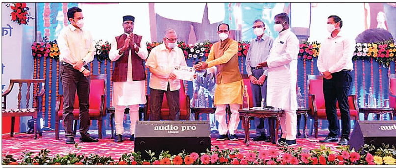
(मुख्यमंत्री श्री चौहान ने डॉक्टरों से संवाद और उनका सम्मान)

मुख्यमंत्री श्री चौहान ने कोरोना महामारी के कठिन समय में अपनी असीमित सेवाओं और कर्तव्यपरायणता से मानवसेवा करते हुए अपने प्राणों की आहुति देने वाले डॉक्टरों का स्मरण करते हुए उन्हें भावपूर्ण श्रद्धांजलि अर्पित की।