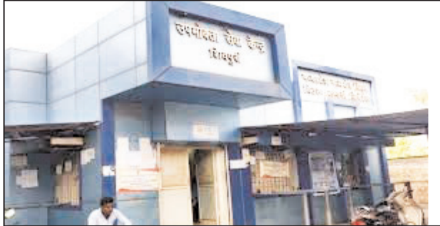
कर्मचारी निर्देशों का पालन नहीं करता है तो उसके विरुद्ध कार्यवाही की जाएगी।

शिवपुरी। मध्य विद्युत क्षेत्र वितरण कंपनी द्वारा लगातार विद्युत आपूर्ति की सुचारू व्यवस्था के लिए कंपनी कार्यक्षेत्र के 16 जिलों के बिजली कार्मिकों को 24x7 दिवस अपने फोन चालू रखने के निर्देश दिये गए हैं। गौरतलब है कि बारिश, आंधी, तूफान आदि के कारण विद्युत लाइनों में खराबी आने के कारण विद्युत आपूर्ति बाधित होने की संभावना होती है। इस दौरान आई खराबी एवं विद्युत लाइनों को दुरुस्त करने में काफी समय लग जाता है, जिसके कारण उपभोक्ताओं को लगातार विद्युत आपूर्ति किए जाने में कठिनाई का सामना करना पड़ता है।