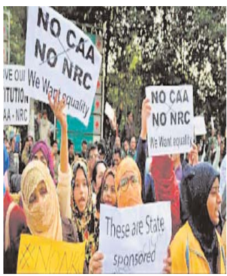
ज्वालियर | वर्ष : 03 अंक:40