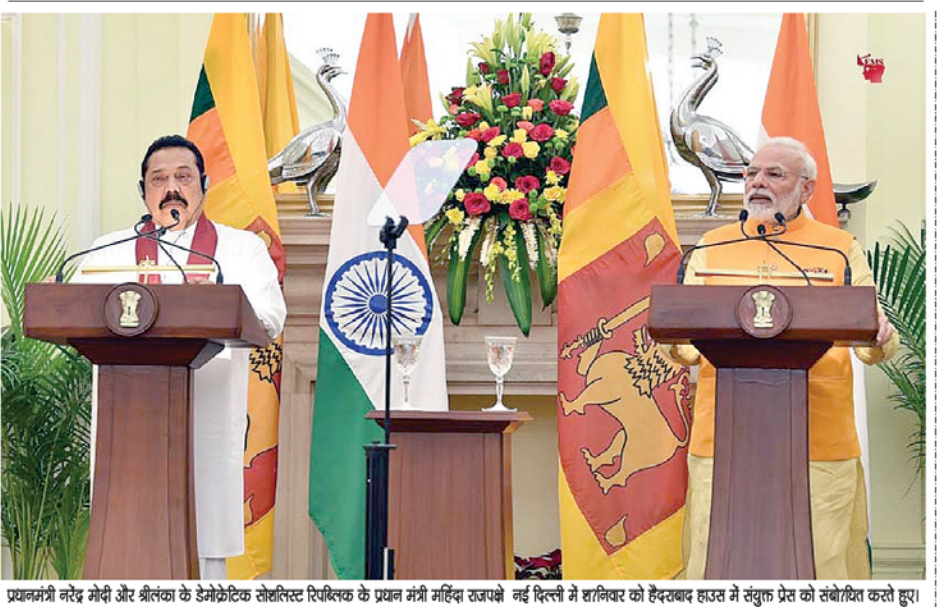
प्रधानमंत्री नरेंद्र मोदी और श्रीलंका के डेमोक्रेटिक सोशलिस्ट रिपब्लिक के प्रधान मंत्री महिंदा राजपक्षे नई दिल्ली में शनिवार को हैदराबाद हाउस में संयुक्त प्रेस को संबोधित करते हुए।

कना जारी रखेंगे। श्रीलंका के प्रधानमंत्री महिंदा राजपक्षे 7 से 11 फरवरी तक भारत की यात्रा पर रहेंगे और इस दौरान वे दोनों देशों के संबंधों के विविध आयामों पर व्यापक चर्चा करेंगे। विदेश मंत्रालय के अनुसार, श्रीलंका के प्रधानमंत्री महिंदा राजपक्षे का सरकारी कार्यक्रम 8 फरवरी से शुरू होगा। उनके साथ एक उच्च स्तरीय शिष्टमंडल भी आ रहा है। राजपक्षे अपनी यात्रा के दौरान यह प्रधानमंत्री नरेंद्र मोदी के साथ शिष्टमंडल स्तर की बैठक करेंगे। वे अपनी यात्रा के दौरान चारणसी, सारनाथ, बोधगया और तिस्पाति भी जायेंगे। महिंदा राजपक्षे यहां राष्ट्रपति रामनाथ कोविंद से भी मिलेंगे। विदेश मंत्री एस जयशंकर के साथ भी उनकी बैठक होगी। उप-क्षेत्रीय समुद्री सुरक्षा सहयोग बढ़ाने के लक्ष्य के साथ दोनों देशों के प्रतिनिधिमंडलों के बीच रक्षा एवं समुद्री सुरक्षा पहलों के तहत अहम मुद्दों पर चर्चा होने की उम्मीद है। इन पहलों में श्रीलंका-भारत वार्षिक रक्षा वार्ता और भारत एवं मालदीव के साथ त्रिपक्षीय समुद्री सुरक्षा सहयोग शामिल है।