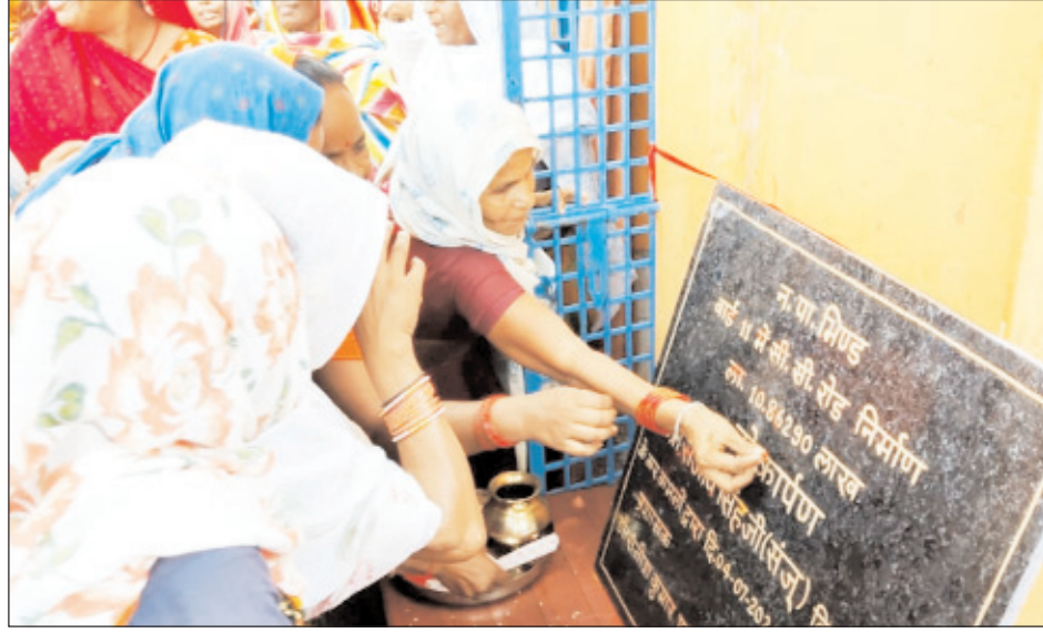
विभिन्न विकास कार्यों का किया गया लोकार्पण

भिण्ड। भिण्ड विधानसभा में विकास कार्यों की झड़ी इसी तरह लगी रहेगी। ये सड़क आप लोगों के गली-मोहल्ले की है जिस कोचड़ और गड्डे वाली गली को आप लोग वर्षों से झेल रहे थे आज वह बनकर तैयार हो गई है। जिसका आप लोग वर्षों तक उपयोग करेंगे। आप लोग ही इस पट्टिका से पदा हटाकर सड़क का लोकार्पण