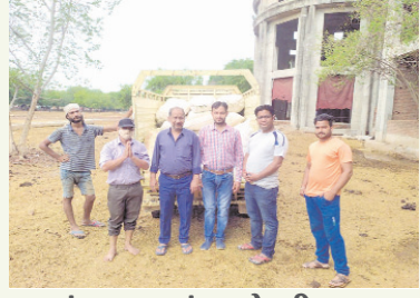
बजरंग भक्त मंडल ने की 1650 किलो हरे चारे की सेवा