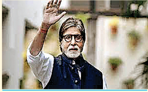
महानायक अमिताभ बच्चन ने फैस को कोरोना के खिलाफ किया खबरदार