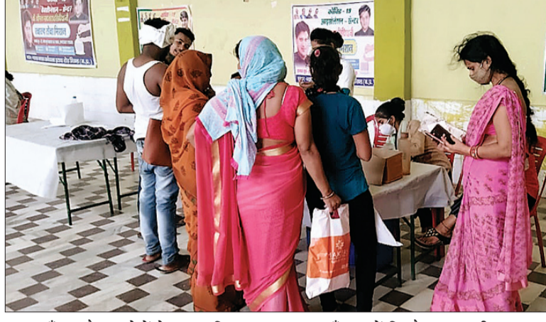
वहाँ पर मौजूद लोगों ने बताया कि सुबह से लाइन में लग होने के बाबजूद भी नम्बर नहीं लग पा रहा है यहाँ बात दें कि कैलाश वासी माधवराव सिंधिया स्वास्थ्य सेवा मिशन के तहत 31 अप्रैल से प्रारंभ होकर प्रतिदिन काफी संख्या

भिण्ड घ कैलाशवासी माधवराव सिंधिया स्वास्थ्य सेवा संगठन अभियान के तहत भिंड शहर के व्यापार मंडल धर्मशाला परिसर में कैलाश वासी माधवराव सिंधिया स्वास्थ्य सेवा मिशन द्वारा संचालित कोविड-19 वैक्सीनेशन सेंटर पर लगभग 5 सैकड़ लोगों ने वैक्सीन लगवाई। वैक्सीन लगवाने आए महिला,युवाओं और बुजुर्गों ने बताया कि वैक्सीनेशन सेंटर पर बहुत भीड़ होने की वजह से सुबह से कतार में खड़े हैं।और 3 घंटे हो गए अभी तक वैक्सीन नहीं लग पाई।हम सब लोग पूर्ण रूप से सुरक्षित होने के लिए वैक्सीन लगवाने आये हैं