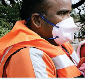
महाराष्ट्र में बारिश के चलते हालात