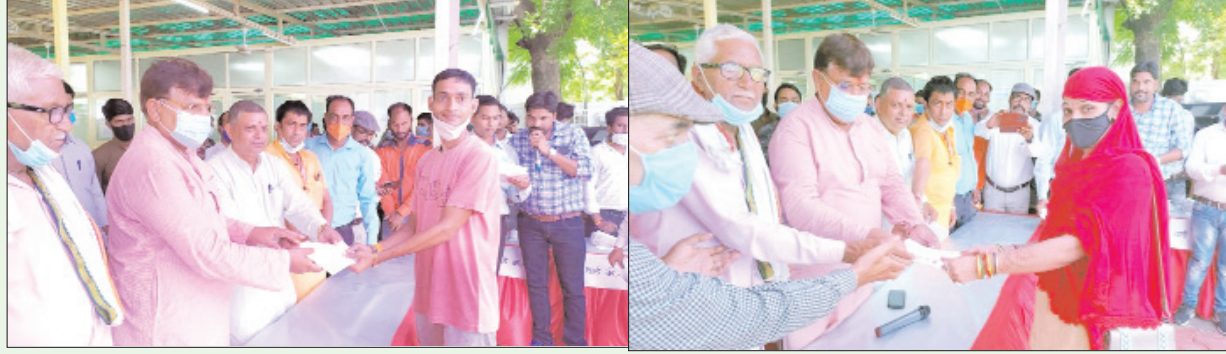
बनाये जा रहे हैं फिर भी कोई पात्र हितग्राही जायेगा। साथ ही सभी पात्र हितग्राहियों को लिए में वचनबद्ध हैं। 38 नम्बर कार्यालय पर आए आमजनों की समस्याओं को ऊर्जा मंत्री