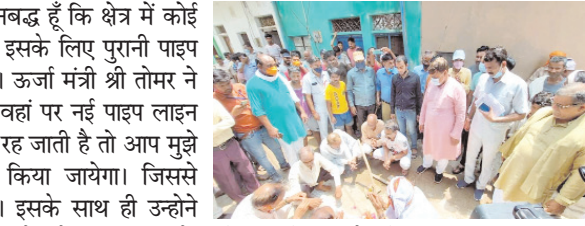
ऊर्जा मंत्री श्री तोमर ने वार्ड-7 में पानी की पाइप लाइन का किया भूमिपूजन

ग्वालियर। प्रदेश सरकार के ऊर्जा मंत्री श्री प्रद्युम्न सिंह तोमर ने वार्ड -7 स्थित व्यास वाली गली में पानी की पाइप लाइन के भूमि पूजन के अवसर पर कहा कि क्षेत्र में गंदे पानी की समस्या के निदान के लिए अमृत योजना के तहत पानी की लाइन डाली जा रही है। उन्होंने कहा कि मैं वचनबद्ध हूँ कि क्षेत्र में कोई भी व्यक्ति प्यासा न रहे, सबको शुद्ध पेयजल मिले। इसके लिए पुरानी पाइप लाइन को बदलकर नई पाइप लाइन डाली जा रही है। ऊर्जा मंत्री श्री तोमर ने कहा कि जहाँ भी गंदे पानी की समस्या आ रही है, वहाँ पर नई पाइप लाइन डालने का कार्य किया जा रहा है। फिर भी कोई गली रह जाती है तो आप मुझे अवगत कराएँ, वहाँ भी लाइन डालने का कार्य किया जायेगा। जिससे क्षेत्रवासियों को शुद्ध पेयजल समय पर मिल सके। इसके साथ ही उन्होंने अधिकारियों को निर्देशित कि पेयजल सप्लाई के समय क्षेत्र में भ्रमण कर गंदे पानी व पानी न आने की समस्या का निराकरण समय पर करें। उन्होंने वार्ड-7 के अंतर्गत इंदिरा कॉलोनी, लूटपुरा, व्यास वाली गली आदि क्षेत्रों में भ्रमण कर आमजन की समस्याएँ सुनी व संबंधित अधिकारियों को समस्या के निराकरण के लिए मौके पर ही निर्देशित किया। साथ ही कहा कि राशन की पात्रता पर्ची के लिए क्षेत्रीय कार्यालय पर शिविर लगाये जा रहे हैं, जहाँ आप फार्म जमा कर सकते हैं।