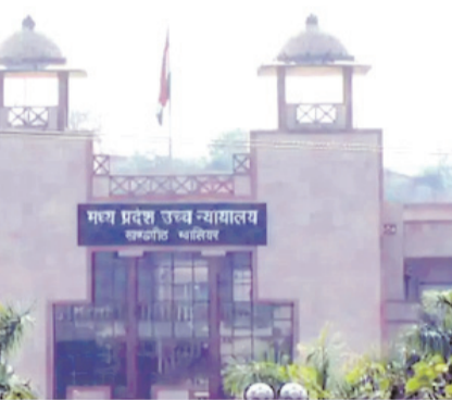
एक किलोमीटर के रास्ते पर कई बार तलाश किया। पर कुछ पता नहीं चला और परिजन पनिहार थाने पहुंचे। बच्ची के इस तरह लापता होने को पुलिस ने गंभीरता से लिया। बच्ची की तलाश शुरू की, लेकिन देर रात तक उसका कुछ पता नहीं लगा। पुलिस को 13 घंटे बाद 5 जुलाई 2017 को सुबह 5 बजे लापता के स्कूल और घर के रास्ते के

पनिहार के नयागांव निवासी एक 8 साल की मासूम बच्ची जो कक्षा तीसरी की छात्रा थी। वह 4 जुलाई 2017 को सुबह 11 बजे गांव के शासकीय प्राथमिक विद्यालय के लिए घर से निकली थी। शाम 4 बजे स्कूल की छुट्टी के बाद जब मासूम घर नहीं पहुंची तो परिजन ने उसकी तलाश शुरू की। स्कूल में भी कक्षा की बेंच पर उसका बैग और टिफिन रखा मिला था। स्कूल में 4 बजे तक उसे देखे जाने का भी पता लगा। जिससे यह साफ था कि वह स्कूल आई थी। इसके बाद परिजन ने स्कूल और घर के बीच