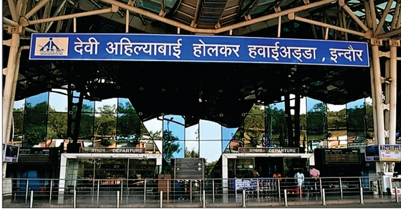
देवी अहिल्याबाई होल्कर हवाईअड्डा, इन्दौर

मेट्रो स्टेशन के साथ 20.48 एकड़ भूमि के विकास में मल्टीलेवल कार पार्किंग एवं दो प्रवेश एवं दो निकासी द्वार के निर्माण को मंत्री श्री सिलावट ने आवश्यक बताया है। पुराने टर्मिनल भवन में एक व्ही.आई. पी. टर्मिनल बनाने का अनुरोध राज्य शासन की ओर से एयरपोर्ट अथॉरिटी में लम्बित है। इससे इंदौर एयरपोर्ट पर मुख्यमंत्री जी एवं अन्य व्ही.आई.पी. के आने / जाने की व्यवस्था मुख्य टर्मिनल से पृथक से सुव्यवस्थित हो सकेगी। इसी पुराने टर्मिनल के आधे भाग पर कार्गो टर्मिनल को बढ़ाये जाने पर भी कार्य किया जाना है।