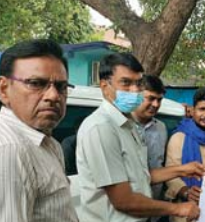
किया गया तो जिला चिकित्सालय भिंड में सफाई कर्मचारी के वेतन काटा तथा जिला चिकित्सालय भिंड में खाई बाँय का काम सफाई कर्मचारियों से करवाया जा रहा है जिससे सफाई कर्मचारियों में रोष व्याप्त तथा समय पर वेतन नहीं मिलने पर सफाई कर्मचारियों ने आज काम बंद कर दिया।