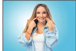
अपने टूथब्रश में रखकर इसे टूथपेस्ट की तरह इस्तेमाल करें। रेश को दांतों पर खीरे-धीरे घुमाएँ। ज्यादा तेजी से ब्रश करने से आपके मरूट्टे छिटा सकते हैं।

इस सख्त परत से परेशान हैं तो आज हम आपको बताने जा रहे हैं कुछ ऐसे घरेलू नुस्खे, जिसके जरिए आप घर पर रहकर ही इस समस्या से निजात पा सकते हैं और चमकवाते दांतों के साथ आपको किसी के सामने हंसने में हिचकतेबहाद भी नहीं होगी। तो कौन से हैं वो घरेलू उपाय, जिनपर बताने हैं आपको- बेकिंग सोडा: दांतों की सफाई और टार्टर से छुटकारा पाने के लिए बेकिंग सोडा बेहतरीन उपाय है। आने कई बार कपड़ों में से दम छुटाने के लिए बेकिंग सोडा के इस्तेमाल के बारे में सुना होगा, लेकिन यह दांतों की हटकर बैक्टीरिया को भी मारता है। इसके साथ ही यह मुँह की गंध भी दूर करता है। कैसे इस्तेमाल करें- बेकिंग साइज में थोड़ा-सा पानी और समक मिलाएँ और फिर इसे