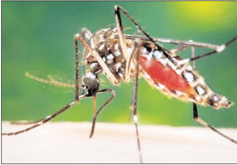
भिण्ड में डेंगू का पहला केस, युवक की मौत

भिण्डा प्रयाग क्षेत्र के अन्य खार्वा के साथ डेंगू के रोग का प्रकोप अब