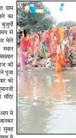
सम्बन्ध बड़ी विद्येता यह है कि एक बार दर्शन करने वाले पाठ को हनुमानजी अवश्य बुढ़वा है। यह वह वक्ताना भूमिगत लोग ग्राम पंचायत

मेराणा, गोरमी तहसील के अंतर्गत ग्राम पंचायत मोरछट में आज मौर छट मेले का आयोजन सौहार्दपूर्ण संपन्न हुआ। प्राथमिक बुढ़वाओं की मौत की रोकथाम के लिये समय से संचालित होता आ रहा है। जिस समय पर मेले का आयोजन किया जाता है उसको स्थान हनुमानजी मंदिर खेपरल के नाम से सुविख्यात है जहाँ दूर दूर से लोग हनुमानजी महाराज की शरण में आकर अपना जीवन सफल बनाने पूजा अर्चना करते हैं जहाँ हर सालवार सत्तवार को श्रद्धालुओं की कान्ना भीड़ रहती है। हनुमानजी मंदिर परिसर में मनुश्री श्रीमान ज्ञानकी मंदिर स्थित है।