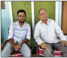
ग्वालियर ■ वर्ष : 4 ■ अंक : 206