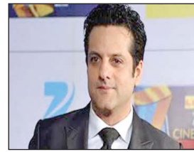
पृष्ठ 8 ■ मूल्य : 2 रु.