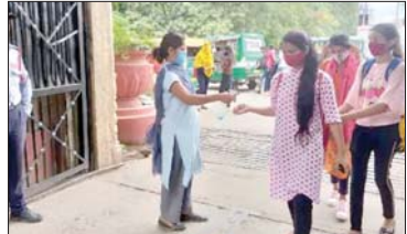
इसका कड़ा पालन कराया। JU में विद्यार्थियों के अभिभावकों को अनुमति भी मंगी गई है। इसके लिए गुल शरीर विद्यार्थियों से शेयर कर उनकी अनुमति

ग्वालियर। कोविड काल के बाद आधिकारिक बुधवार से कॉलेज भी शुरू हो गए हैं। पहले दिन कॉलेज में काफी चहल-पहल नजर आई है। आमतौर पर सभी कॉलेज के गेट पर कॉलेज प्रबंधन की सख्ती नजर आई है। कोविड गाइडलाइन का पालन, वैक्सिनेशन सर्टिफिकेट के बाद ही कॉलेज में प्रवेश मिल सकता है। पर जो वैक्सिनेशन सर्टिफिकेट नहीं ला पाए थे उनको एक दिन की मोहलत दे दी गई है। कॉलेज गेट तक तो चले नियम दिखे, लेकिन कॉलेज के अंदर पहुंचते ही छात्र छात्राएं कोविड गाइड लाइन की धुंधलकें उड़ते हुए नजर आए हैं। पार्क में सोशल डिस्टेंस को