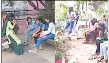
मंगी गई थी जो ज्यादातर छात्रों ने पहाले दिन कॉलेजों का क्या रहा हलत: ग्वालियर के सबसे बड़े गलस

कॉलेज में शुमार घनत्व (कमला राजा गलस कॉलेज) में पहले दिन का हाल मिला जुला रहा है। कॉलेज के गेट पर धमल स्कॉमिंग के साथ छात्रों की अंदर प्रवेश दिया गया। गेट पर ही हंड सैनिटाइज करवाएं। सोशल डिस्टेंस बनाए रखने की सलाह दी। इतना ही नहीं सूट से वैक्सिनेशन सर्टिफिकेट और परिन का अनुमति पत्र भी देखा गया है। कॉलेज गेट से एंटर होते समय तो छात्राएं पर नियम में दिखीं, लेकिन अंदर कॉलेज के पार्क में पहुंचते ही मास्क उतारकर जेब में रख लिया और एक दूसरे के गले में हाथ छूटकर सोशल डिस्टेंस की धुंधलकें उड़ गईं।