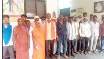
सर्कल के 46 गांव के हजारों लोग खेत, फसल व गृहस्थी का सामान और पभावित हुए थे। बाढ़ में लोगों के मकान, मवेशी तक बह गए थे। लोग तिरपाल