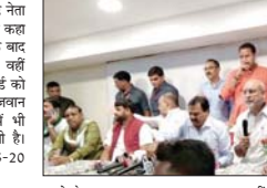
बनने के बाद प्रथम बार नगर आमरण