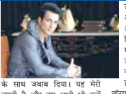
उन्हें कोई दिक्कत नहीं आई। अपने अकाउंट में अर्थ दिवंगी पाए।

उन्हें कोई दिक्कत नहीं आई। अपने अकाउंट में अर्थ दिवंगी पाए। अपने अकाउंट में अर्थ दिवंगी पाए। अपने अकाउंट में अर्थ दिवंगी पाए।