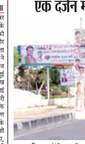
ग्वालियर। केन्द्रीय नागरिक उड्डान मंत्री

बनने के बाद प्रथम बार नगर आमरण नही दी है। लेकिन उनका कार्यक्रम कम अनुसरण हो होगा। उन्होंने कहा कि वह किसी से उद्वारण नहीं चाहते लेकिन कल कांग्रेस कार्यकर्ता फूलवारण पर धरना प्रदर्शन काली पेट्टी बांध कर राजनैतिक दलों को अलग अलग मापदंड गलत है। उन्होंने कहा कि इसी मापदंडकारी नीति को लेकर कांग्रेस गांधी उद्यान के पास काली पेट्टी बांध कर धरना प्रदर्शन करेगा। हालांकि प्रशासन ने अभी तक इसकी अनुमति