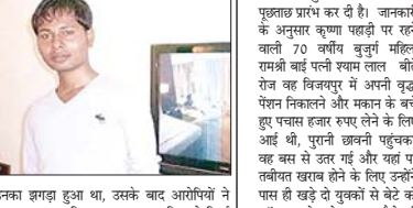
जल्द आरोपियों को पकड़ने की कड़ी बात: थाना प्रभारी का कहना है कि फल व्यवसायी दंपती को शिकयत पर फायरिंग करने वाले बदमाशों के आधाशन दिया।

गोली उनके सिर के ऊपर से निकल गई आरोपी दो दसरा फायर करने का प्रयास किया, लेकिन गोली मिस हो गई। वारदात के बाद आरोपी भाग निकले। मामले का पता चलते ही पुलिस मौके पर पहुँची और जांच के बाद मामला दर्ज कर लिया है। पीड़ित दंपती ने बताया है कि दो महीने पहले आरोपियों से उनका झगड़ा हुआ था, उसके बाद आरोपियों ने चार बार हमला किया था। हर बार पुलिस ने सिर्फ आवेदन लेकर कोई कार्रवाई नहीं की।