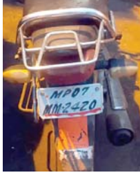
पुलिस ने 6 घंटे के अंदर दो लुटेरों को पकड़ा: बुजुर्ग महिला ने मांगी थी मदद, रास्ते में लूट लिया

पुलिस अधिकारियों ने 2 टीम गठित कर लुटेरों को पकड़ा: घटना के बाद पुलिस अधिकारियों ने दो पुलिस टीमें बनाकर मुदराले की तो पता चला कि वारदात को अंजाम देने