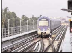
रेल मंत्री पीयूष गोयल पहले फेज का करीब उद्घाटन

कोलकाता एजेंसी। देश में सबसे पहले मेट्रो सेवा शुरू कर इतिहास रचने वाला कोलकाता आज फिर एक नया इतिहास रचने को तैयार है। कोलकाता में पहली मेट्रो सेवा 1984 में ही शुरू हो गई थी, इसका सिलसिला 21वीं सदी में भी जारी है। रेल मंत्री पीयूष गोयल बुधवार को कोलकाता ईस्ट-वेस्ट मेट्रो सेवा को हरी झंडी दिखाएंगे। इसके बाद शुक्रवार (14 फरवरी) को इसे आम जनता के लिए खोल दिया जाएगा। इस मेट्रो सेवा से सबसे बड़ी खासियत है कि यह अंडर वाटर यानि पानी के नीचे बनी सुरंग में चलेगी। साथ ही यह देश की सबसे सस्ती