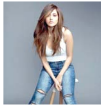
उन्होंने पहले नहीं किया है। अपने किरदार के