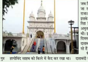
ये होंगे कार्यक्रम: ग्वालियर किले पर हरागोविंद साहब को किले में केद कर रखा था। दाताबंदी छोड़ गुरुद्वारा स्थित है। यहां पर 4 से 6

देश भर से श्रद्धालु शामिल होने के लिए पहुंचे। श्रद्धालुओं को सुरक्षा के बाद इंतजाम करने वाली समिति से संबंधित रहना में आने के लिए कहा गया है। इसके साथ ही कार्यक्रम के दौरान बंद विशाल क्षेत्रों में भी लगाए जा रहे हैं। 50 हजार मार्क यहां आने वाली को रिसट पंच दाता देवी छोड़ दिवस के रूप में मनाना जाता है। इस पंच दाताबंदी छोड़ दिवस को 400 साल पूरे हो रहे हैं।