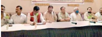
ग्वालियर। अखिल भारतीय क्षत्रिय महासभा ग्वालियर (संयुक्त मोर्चा) ने कहा है कि जिला प्रशासन उच्च न्यायालय ग्वालियर के गुरुल पीठ द्वारा दिये गये निर्णय के अनुसार सम्राट मिहिर भोज की प्रतिमा को नवीच / नामकरण पेटिका को पूर्णतः ढके नहीं मुक्ति को आज अनुमानित के लिये खुला रखा जाये। जिससे सर्व समुदाय सम्राट मिहिर भोज के शौर्य और पराक्रम से परेण ले सके।

पुलिस ने 02 स्याई व 01 गिरफ्तारी वार्ड में फरार चल रहे बदमाश को किया गिरफ्तार