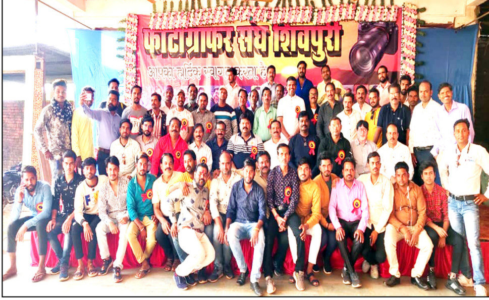
फोटोग्राफर संघ शिवपुरी का दीपावली मिलन एवं अन्नकूट कार्यक्रम संपन्न शिवपुरी।

आज के दौर में देखने को आ रहा है कि आज भले ही कितने भी मोबाइल चल गए हो बाबजूद