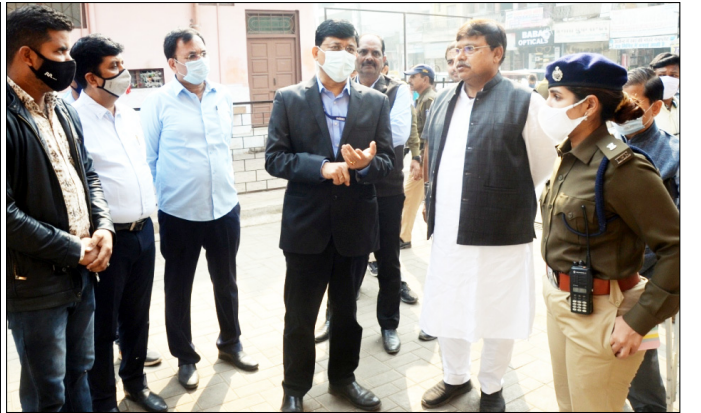
ओल्ड हाईकोर्ट वाली पार्किंग में 34 चार पहिया वाहन एवं राजीव प्लाजा वाली पार्किंग में 36 चार पहिया वाहन एवं 40 दो पहिया वाहन खड़े होने की क्षमता है। ऊर्जा मंत्री श्री तोमर ने इस अवसर पर क्षेत्र के व्यवसाय एवं दुकानदारों से आग्रह किया कि क्षेत्र में सुगम यातायात एवं व्यवस्थित यातायात व्यवस्था के लिए सभी दुकानदार अपने वाहन पजल पार्किंग में ही रखें और अपने ग्राहकों को भी पार्किंग में ही वाहन रखने के लिए प्रेरित करें। इस अवसर पर अपर आयुक्त श्री मुकुल गुप्ता, नोडल अधिकारी श्री अरविंद चतुर्वेदी, नोडल अधिकारी राजस्व श्री लोकेंद्र सिंह चौहान सहित अन्य संबंधित अधिकारी उपस्थित रहे।