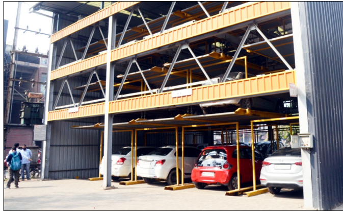
ओल्ड हाईकोर्ट वाली पार्किंग में 34 चार पहिया वाहन एवं राजीव प्लाजा वाली पार्किंग में 36 चार पहिया वाहन एवं 40 दो पहिया वाहन खड़े होने की क्षमता है। ऊर्जा मंत्री श्री तोमर ने इस अवसर पर क्षेत्र के व्यवसाय एवं दुकानदारों से आग्रह किया कि क्षेत्र में सुगम यातायात एवं व्यवस्थित यातायात व्यवस्था के लिए सभी दुकानदार अपने वाहन पजल पार्किंग में ही रखें और अपने ग्राहकों को भी पार्किंग में ही वाहन रखने के लिए प्रेरित करें। इस अवसर पर अपर आयुक्त श्री मुकुल गुप्ता, नोडल अधिकारी श्री अरविंद चतुर्वेदी, नोडल अधिकारी राजस्व श्री लोकेंद्र सिंह चौहान सहित अन्य संबंधित अधिकारी उपस्थित रहे।

गवालियर। शहर के इंदरगंज नदी गेट क्षेत्र में सुगम यातायात एवं व्यवस्थित पार्किंग व्यवस्था के लिए निगम द्वारा ओल्ड हाई कोर्ट एवं राजीव प्लाजा पर बनाई गई पजल पार्किंग को निगमायुक्त श्री किशोर कन्याल के विशेष आग्रह पर संबंधित कंपनी द्वारा संधारित कर प्रदेश सरकार के ऊर्जा मंत्री श्री प्रद्युम्न सिंह तोमर एवं नगर निगम आयुक्त श्री किशोर कन्याल की उपस्थिति में पुनः प्रारंभ कराया गया तथा आगामी दो महीने तक कंपनी द्वारा दोनों पार्किंग का संधारण एवं संचालन किया जाएगा। ज्ञात हो कि लॉकडाउन के समय लंबे समय तक बंद रहने के कारण दोनों पार्किंग में वाहन उपर के फ्लोर पर नहीं जा पा रहे थे तथा संबंधित कंपनी का संचालन एवं संधारण के ठेके की अवधि पूर्ण हो चुकी थी। जिसको लेकर निगमायुक्त श्री किशोर कन्याल के विशेष अनुरोध पर कंपनी द्वारा पुनः अपने इंजीनियर भेजकर दोनों पार्किंग का संधारण कर आज से पुनः प्रारंभ कराई गई।