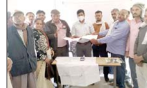
उपलब्ध है तो उपजाऊ एवं सिंचित जमीन से अटल एक्सप्रेस-वे क्यों निकाला जा रहा है। किसानों की उपजाऊ भूमि हल्वे में चली जादेगी तो किसान बंजरा हो जाएंगे। इसके बदले तो बीहड़ो भूमि किसानों को दी