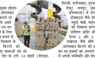
फ्रिज, फ्रीडाबाद, गुराणा, गाजियाबाद, नोएडा, अमरदाबाद, मैसूर, जयपुर, मुंबई, हैदराबाद, चेन्नई, पौर और कोलकाता) में फल और सब्जियां, फ्रोजन और चिल्ड प्रोडक्ट्स जैसे स्टोर और मोटो, ड्राई गोरोरी आइटम, ब्यूटी, बेबी, पर्मलन केयर, और पेट प्रोडक्ट्स के चयन के डिजिटल अमेजान फेरा एप-इन-एप अनुभव के माध्यम से ग्लोबली के लिए खरीदारी अनुभव को आसान बनाने में सक्षम बनाना (सहजता की परेशकरी के अभाव में)।

प्रतिबद्धता से प्रेरित है। उन्होंने कहा कि एकोरमर्च का मुख्य उद्देश्य उपभोक्तियों को बेहतर ऑनलाइन खरीदारी अनुभव प्रदान करना है।