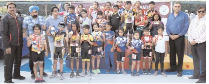
स्पर्धा के अंतिम दिन किंग वन लेन का हार्ड में बालक 5-7 वर्ष आयु वर्ग में भाग लेते हुए...

इन्दौर । शहर में अग्रेजीत राज्य रोलर स्केटिंग स्पर्धा में भोपाल ने ओवरऑल चैंपियनशिप जीती।