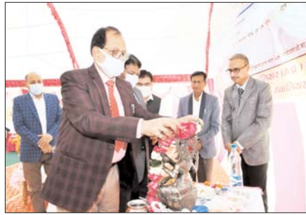
उर्वां ग्राम पंचायत में वृहद विधिक जगुरूकता शिबिर का आयोजन