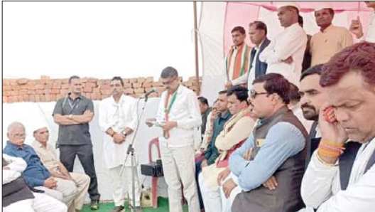
बढ़ती महंगाई के खिलाफ कांग्रेस ने निकाली जनजागरण यात्रा

जौहरी। बदामना त्रस्त में बढ़ती महंगाई, बेरोजगारी, भ्रष्टाचार से जनता त्रस्त है। केन्द्र एवं प्रदेश की भाजपा सरकार की मनमानी नीतियों एवं अक्रियता से महंगाई लगातार बढ़ती जा रही है। देश का हर वर्ग महंगाई से त्रस्त है। भाजपा