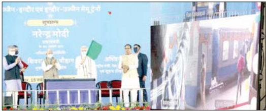
भारतीय रेल का गौरव: प्रधानमंत्री ने कहा कि भोपाल के इस ऐतिहासिक रेलवे स्टेशन का केवल कायाकल्प ही नहीं हुआ है बल्कि किरादारुद्ध को रानी कमलापति का इसमें नाम जुड़ने से इसका महत्व और बढ़ गया है। उन्होंने कहा कि मॉडर्न के गौरव से आज भारतीय रेल का गौरव भी जुड़ गया है।

भोपाल। मध्यप्रदेश का रानी कमलापति रेलवे स्टेशन देश का पहला विश्वस्तरीय मॉडर्न स्टेशन है, जहां अंतरराष्ट्रीय इकाईअंशे की तर्ज पर पात्रियों को सभी सुविधाएं मुहैया कराई गई हैं। प्रधानमंत्री नरेंद्र मोदी ने सोमवार को इस स्टेशन का उद्घाटन किया। इसके बाद प्रधानमंत्री ने कार्यक्रम को संबोधित किया और आज के दिन को भोपाल, मध्यप्रदेश और देश के लिए अहम बताया। प्रधानमंत्री मोदी ने कहा कि हमने किस तरह सच होते हैं भारतीय रेलवे इसका उत्तम उदाहरण बना रहा है। छह-सात साल पहले जिसका पला रेलवे से पड़ना था वह इसे कोसों दूर ही नजर आता था। स्टेशन पर गंदगी, ट्रेनों की लेटलतीफी, स्टेशनों पर बूझने और खाने पीने की अस्तव्यथा, सुड़ा खाने की चिंता व दुर्घटना का डर जैसी समस्याएँ थीं। गौड़वना के गौरव से जुड़ा