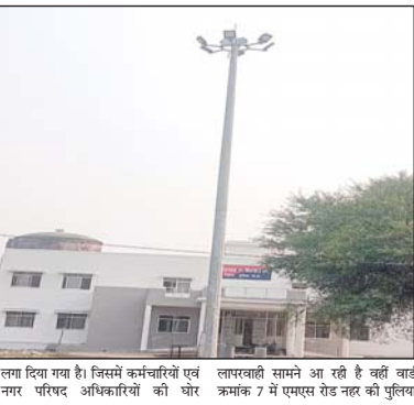
लाग दिया गया है। जिसमें कर्मचारियों एवं नगर परिषद अधिकारियों की चोर लापरवाही सामने आ रही है वहीं हाई मास्ट क्रमकां 7 में एमएस रोड नगर की पुलिस

केदारसा। नगर परिषद द्वारा शहर में लगाए गए हाईमास्ट निर्माणन नहीं लगाए गए हैं और वैधानिक रूप से फाइल में अंकित स्थल के स्थान पर अन्य जगह लगाए जा रहे हैं। पहाड़गड रोड नगर पर लगाए जाने वाला हाई मास्ट थाना प्रोग्राम के तहत में लगाया गया है। जिसका नगर परिषद केदारसा में कोई लेखा-जोखा नहीं है। नगर परिषद केदारसा में केवल हाई मास्ट नगर पर लगान बताया जा रहा है। लेकिन नगर परिषद केदारसा के आला अधिकारी की लापरवाही एवं राजनीतिक दबाव के चलते यलत जगह पर लगाए गए हैं। जो अनुपयोगी हैं इस पूरी लापरवाही में नगर परिषद अधिकारियों तो दोषी हैं ही, साथ में सख इजीनियर भी दोषी माना जा रहा है। क्योंकि जब हाई मास्ट लगाया जा रहा था, तब सख इजीनियर ने सभी जगह कर क्यों नहीं लगाया।