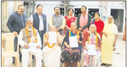
ग्वालियर। नगर निगम सीमाक्षेत्र के अंतर्गत वृद्ध आश्रम में निवासरत वृद्धों के लिए लिखित