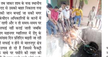
राश दी जाती है मगर डेवलपमेंट मात्र कामजो है ही दयन होकर रह जाता है

मालनपुर। उधोग क्षेत्र मालनपुर सूरीकरण की नगरी कहा जाता है मगर एकविनन द्वाग बनाया गया नाला खुला होने से हादसों को दिया जा रहा है न्योला अलग यह है कि मालनपुर फैक्ट्रियों के द्वाग निकलने वाले पानी के लिए एकेशीय के द्वाग सिरीसी नाला का निर्माण कराया गया है नाला खुला छोड़ देने से कभी भी हो सकती है दुर्घटना बर्बाद सीसी नाला 4 फुट चौड़ा और 7 फुट गहरा बनाया गया है आबारा मवेशी आबारा कुत्ते कई बार नाले में गिर जाने से उनकी मौत हो गई है। अभी कुछ दिन पहले की बात है कैडबरी के सामने एक गाग माल खाते-खाते नाले में चली गईं पूरे दिन व