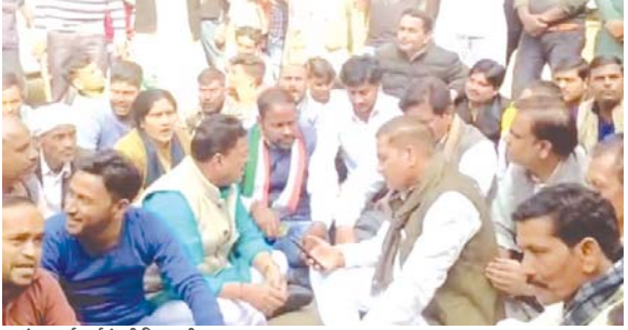
कांग्रेस कार्यकर्ताओं की गिरफ्तारी को लेकर जिलाध्यक्ष ने क्या कोवाली में धरना प्रदर्शन

भिण्ड। भिंड शहर के धनवती कॉन्वेल्वेज के पास स्थित मंदिर को विधि विधान के बिना ही तोड़ने को लेकर 30 नवंबर मंगलवार को कांग्रेस कार्यकर्ताओं ने पुलिस एवं प्रशासन के सामने विरोध प्रकट किया तो पुलिस ने आधा दर्जन से अधिक कांग्रेस कार्यकर्ताओं को गिरफ्तार कर लिया। उक्त मामले को लेकर अखिल