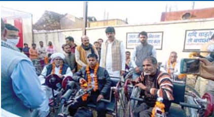
कार्यालय में आयोजित दिव्यांगजन के रिक्शा वितरण कार्यक्रम में जन हितवादी एवं जनसम्पर्क के संबोधित करते हुए व्यक्त किए घ इस