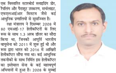
एक विस्तारित स्टारबोई स्काइडिंडे डोर, रेलिंग और पारपेट उभारकर, कंचंदलट, एमएलआरआर सिरिसम जैसे कई आस्थुतिक प्रभावितों से समुद्रतट में...

तमिलनाडु के नीलगिरी जिले के कुजूर में भारतीय वायुसेना का एमआइ-17बी5 हेलीकॉप्टर क्रैश हो जाने के दर्दनाक हादसे से न केवल भारतीय सेना के तीनों अंग बल्कि समूचा देश गहरे सदमे में है। वायुसेना द्वारा इस दुर्घटना के कारण जानने के लिए जांच का आदेश दे दिया गया है।