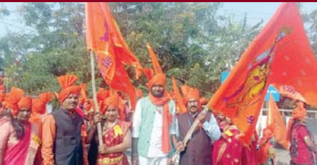
ग्वालियर-भोपाल में केसरिया जागत मंच का प्रोग्राम का आयोजन किया जा रहा है जिसमें मुख्य अतिथि माननीय नरोत्तम मिश्रा जी गृह मंत्री मंत्री महिला मोर्चा तुषि भटनागर उपस्थित रही साथ ही माननीय गृह मंत्री जी को तलवार भेंट करके स्वागत भी किया गया।