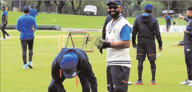
दूसरे टेस्ट को लेकर अभी स्थिति स्पष्ट नहीं: वाइडर्स में 3 से 7 जनवरी के बीच खेले जाने वाले दूसरे टेस्ट में दर्शकों की एंट्री देने को लेकर अभी स्थिति स्पष्ट नहीं है। टिकटरस बिक्री के लिए नहीं रखी गई है। स्टैडियम के आधिकारिक सोशल मीडिया हैंडल पर पोस्ट किया है कि दर्शकों की एंट्री दी जाएगी या नहीं इसको लेकर अभी फैसला नहीं हुआ है। आगे इसकी जानकारी दी जाएगी। साउथ अफ्रीका में रहने वाले भारतीय टीम का क्वारंटाइन : साउथ अफ्रीका मुंबई में रहने वाले भारतीय टीम 3 दिन मुंबई में क्वारंटाइन रहेंगे। वहीं साउथ अफ्रीका पहुंचने पर भी भारतीय टीम 1 दिन क्वारंटाइन पर रहेगी। इस दौरान उनके 3 कोराना टेस्ट भी हुए।

संवुरियन। भारतीय टीम साउथ अफ्रीका के दौरे पर है। उन्हें तीन टेस्ट और तीन वनडे के बीच की सीरीज खेलना है। पहला टेस्ट 26 से 30 दिसम्बर के बीच खेला जाना है। भारत और साउथ अफ्रीका के बीच संवुरियन के सुपर स्पोर्ट्स पार्क में खेले जाने वाले पहले टेस्ट के दौरान स्टैडियम खाली रहेगी। साउथ अफ्रीका में ओमिक्रॉन के बढ़ते हुए मामलों को देखते हुए साउथ अफ्रीका क्रिकेट बोर्ड ने पहले टेस्ट के टिकट नहीं बेचने का फैसला किया है। हार्द कोराना गाइड लाइन के अनुसार सरकार ने 2000 लोगों को एंट्री की अनुमति दी है, लेकिन साउथ अफ्रीका क्रिकेट बोर्ड ने बिना टिकटों की उपस्थिति में ही पहला टेस्ट आयोजित करने का फैसला किया है। हालांकि, स्टैडियम में सुरक्षागश्त और लोकल पदाधिकारी मौजूद रहेंगे।