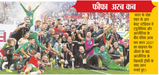
फ़ीफा अरब कब कर के दोहन शहर के अंत स्टैडियम में दूरदर्शन और अंतर्राष्ट्रीय के बीच फ़ीफा अरब का करार 2021 का फाइनल वर्ल्ड जीते के बाद अंतर्राष्ट्रीय के खिलाड़ी टोपी के साथ अरब मनाते हुए।

नई दिल्ली। चैन्नई सुपर किंग्स ने आईपीएल के सबसे कप्तान में से एक वरुण धोनी को आईपीएल 2022 के लिए रिटायर किया है। क्रिकेट के मैदान पर फिर से बिक्री होने से पहले धोनी अपने परिवार साथ समा बिना रहे हैं। धोनी का एक परिवार सहित बीबीबी को भी से बरकर ले रहा है। जिसमें उनकी चिद्रेन देवकृष्ण फौज है। 8 कठोर सत्रों में और न्यूज़लैंड गाइडलाइन को सौंपकर ने 6 कठोर सत्रों में रिटायर किया धोनी ने साउथ अफ्रीका में रहने के दौरान जीत हासिल की, जो साउथ अफ्रीका का जीता पहला वनडे था। धोनी हाल में मुंबई में हुए टी20 वर्ल्ड कप में भारतीय टीम के मेंबर भी थे। हालांकि इसमें टीम इंडिया का सफ़र जय ही खत्म हो गया था।